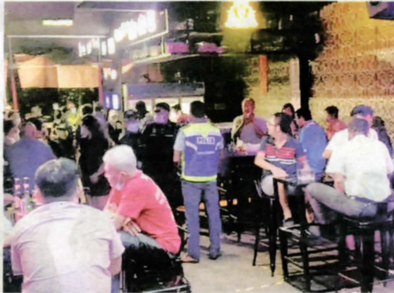
PEMILIK premis hiburan boleh dikenakan tindakan tegas sekiranya masih berdegil dengan beroperasi semasa PKP. – GAMBAR HIASAN

"Pada 12 Disember lalu tangkapan di pusat hiburan mencatatkan angka tertinggi iaitu 292 tangkapan. Oleh itu, saya ingin mengingatkan PBT untuk bertegas menarik semula lesen premis terbabit yang sekali gus akan menghentikan operasi mereka untuk selama-lamanya sekiranya masih berdegil," katanya dalam sidang akhbar Facebook Live semalam.