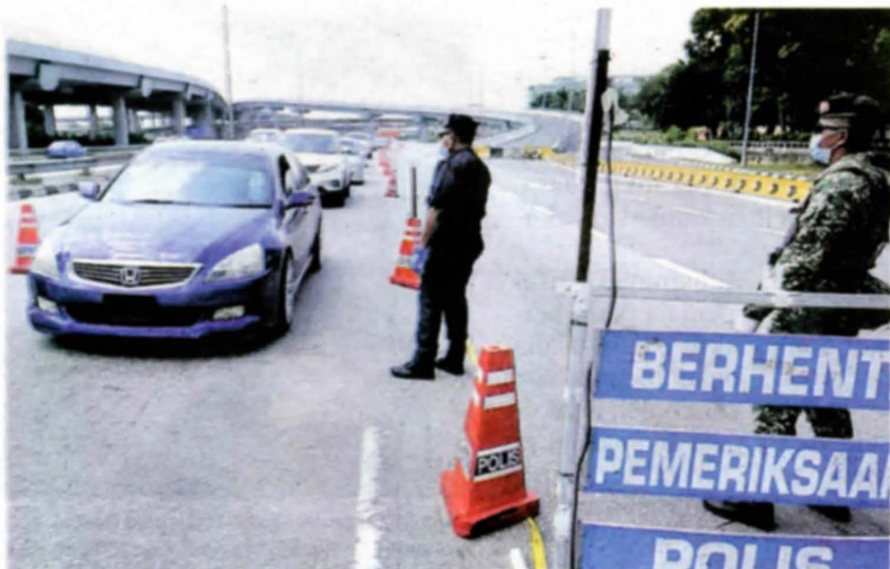
Sekatan jalan raya adalah antara elemen penting dalam mengesahkan penularan wabak Covid-19 di Malaysia.