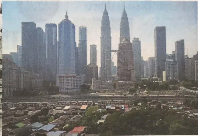
KUALA Lumpur yang bermula di pertemuan dua sungai kini jadi kota metropolitan utama di Asia.