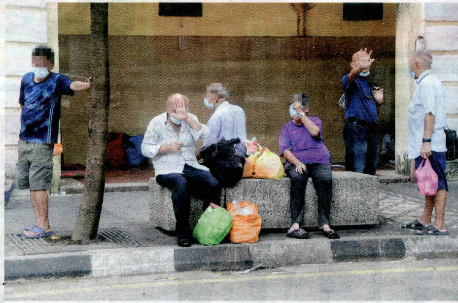
Tinjauan gelandangan di sekitar Kuala Lumpur yang dirakam Sinar Harian .

Pada Julai tahun lalu, Menteri Pembangunan Wanita, Keluarga dan Masyarakat, Datuk Seri Rina Mohd Harun