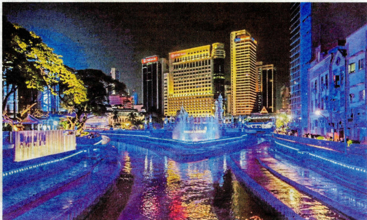
Karya seni awam satu daripada inisiatif mempopularkan dan menjadi ikon sesebuah bandar.