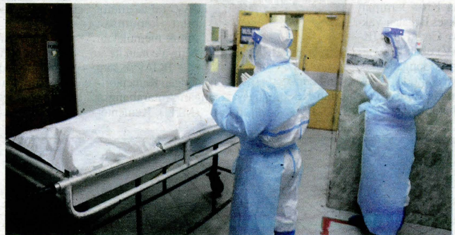
Kakitangan Jabatan Agama Islam Wilayah Persekutuan (Jawi) menunaikan solat jenazah dengan mengehendkan penjarakan fizikal sekurang-kurangnya satu meter.

paru-paru dan organ lain si mati seperti jangkitan kuman paru-paru atau pneumonia tanpa perlu membedah mayat seperti prosedur biasa.