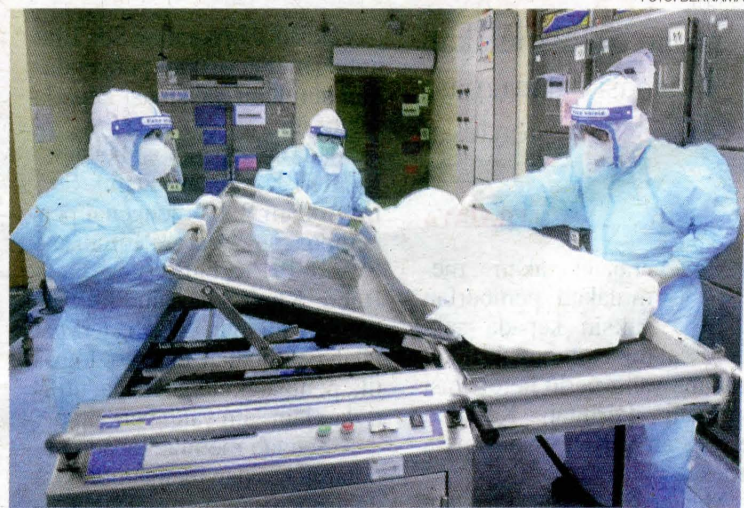
Aspek pemakaian lengkap peralatan peribadi (PPE) semasa mengendalikan jenazah perlu dilaksanakan dengan teliti oleh pasukan petugas dan disegerakan untuk dikebumikan bagi yang beragama Islam atau dibakar bagi bukan Islam.