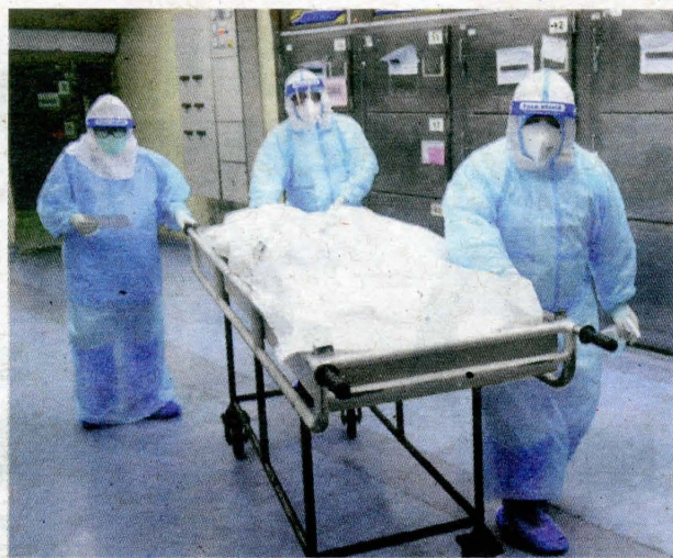
Mayat diusung keluar daripada peti besi berhawa dingin untuk proses pengecaman jenazah sebelum melaksanakan tayamum dan solat jenazah ke atas mayat tersebut.

Beliau berkata, ketika gelombang pertama pandemik itu, kematian Co-