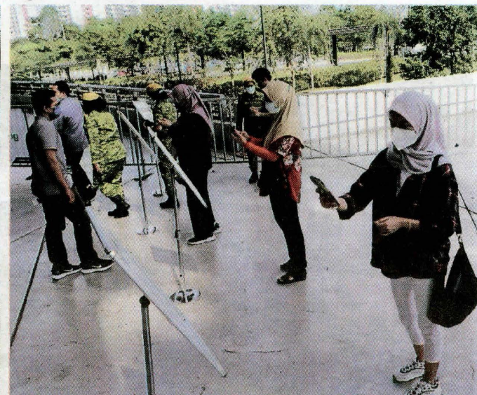
PPV Mega Stadium Nasional Bukit Jalil mempunyai 78 ruang suntikan dengan 1,600 ruang menunggu dalam satu-satu masa.