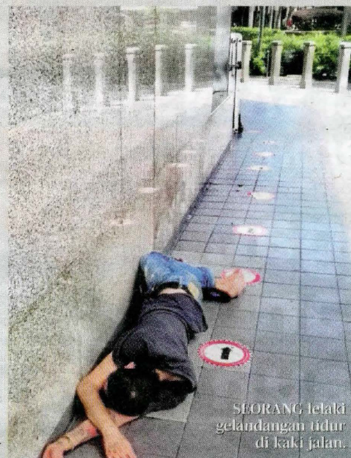
SEORANG lelaki gelandangan tidur di kaki jalan.