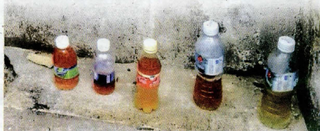
BOTOL berisi air kencing yang disusun gelandangan yang berkeliraran di Pasar Seni.

"Abang jenguk sini, singgah waktu malam!, lagi ramai gelandangan boleh abang jumpa. Dulu mereka hanya ramai berkumpul di Jalan