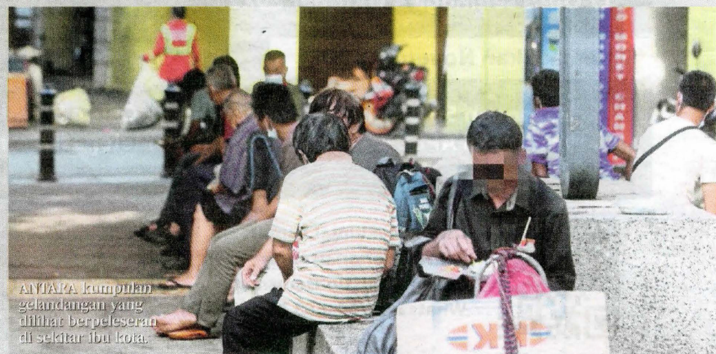
AIYIAPA kumpulan gelandangan yang dilihat berpelesenan di sekitar ibu kota.