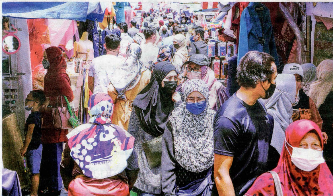
PENGUNJUNG mula membanjiri Jalan TAR seawal pukul 8 pagi.

"Saya memperuntukkan RM500 untuk baju raya tahun ini dengan tema warna merah valentino. Aidilfitri tahun ini lebih meriah kerana sudah dua tahun berturut-turut kita terkurung