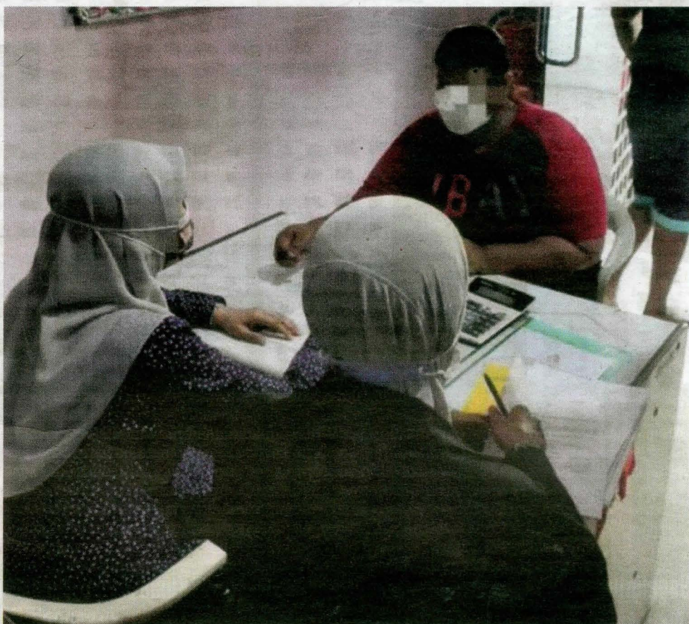
PROGRAM Turun Padang Sesi Bersemuka untuk bertemu penyewa 'bermasalah' di PPR Kerinchi, Lembah Pantai, Kuala Lumpur.

"Bancian unit rumah turut dijalankan bagi mengenal pasti penyewa bermasalah, cuma kami tidak berkompromi dengan penyewa yang menyewakan unit rumah kepada orang lain, warga asing atau melakukan perbuatan jenayah atau pengambilan dadah dengan membatalkan peruntukan unit rumah mereka," katanya.