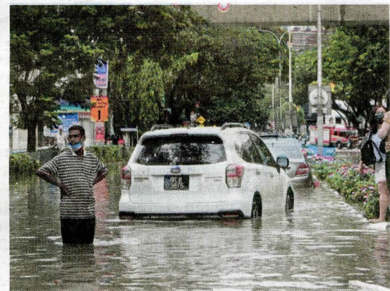
Kereta terkandas dalam banjir kilat di Jalan Sultan Azlan Shah susulan hujan lebat kira-kira satu jam.