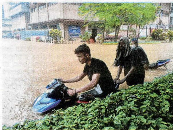
Kejadian banjir kilat di sekitar Masjid Jamek, semalam.

“Hujan lebat di sekitar pusat bandar. Terdapat lokasi air bertakung dan banjir di pusat bandar. Berhati-hati ketika memandu,” katanya.