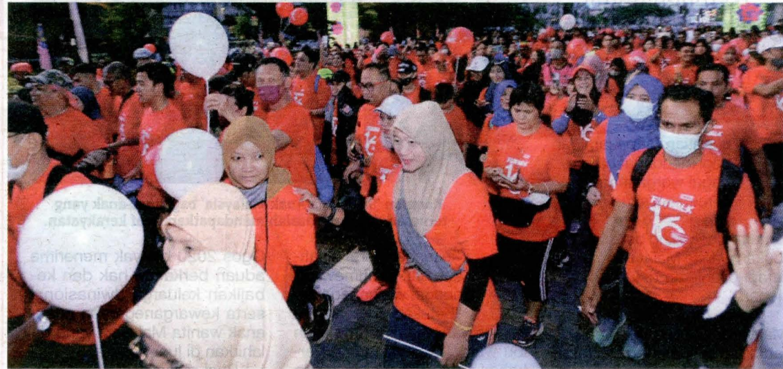
Peserta Fun Walk Sinar Harian 16 memulakan perjalanan sejauh lima kilometer kira-kira jam 7 pagi, Ahad.