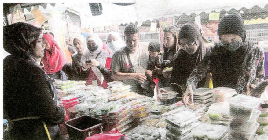
Orang ramai tidak melepaskan peluang mengunjungi Bazar Ramadan Stadium, di Kuantan, semalam.