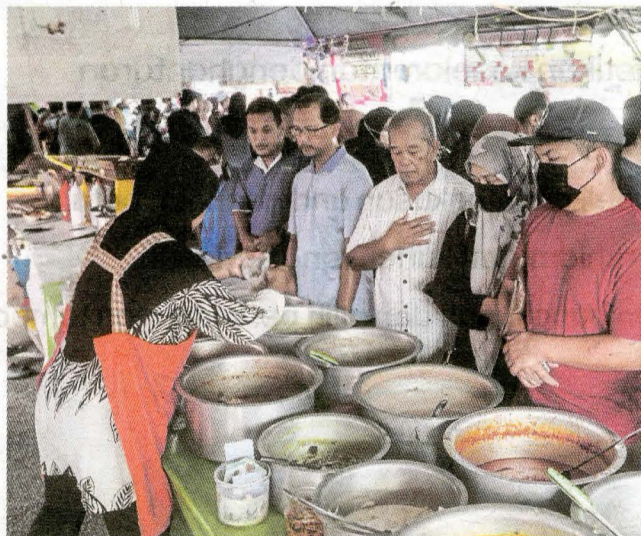
Pengunjung melihat pelbagai juadah berbuka puasa di gerai aneka lauk ketika tinjauan di Bazar Ramadan, Chabang Tiga.