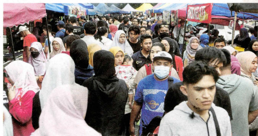
Orang ramai mengunjungi bazar Ramadan untuk membeli juadah berbuka puasa ketika tinjauan di Bazar Ramadan Seksyen 7, Bandar Baru Bangi.