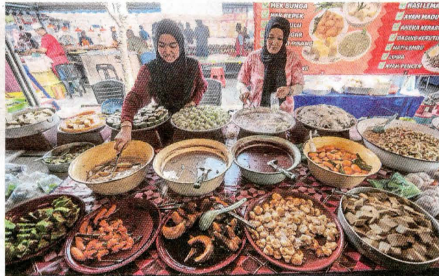
Pelbagai jenis kuih tradisional di Bazar Ramadan, Chabang Tiga, Kuala Terengganu.