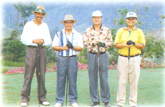
Datuk Bandar menghadiri pertandingan golf Ikatan di Bukit Unggul Golf Century Club, Dengkil Selangor