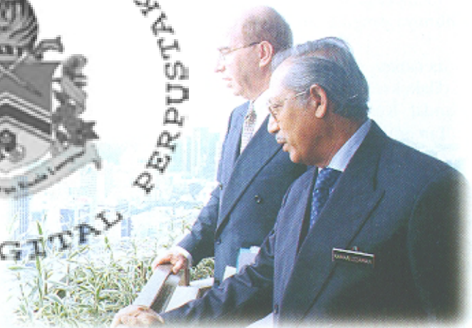
Datuk Bandar London Rt. Hon. Peter Levene