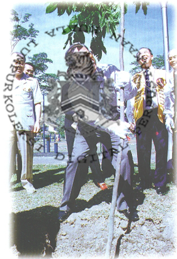
Pokok yang ditanam memperingati ulang tahun Kelab Lions ke 40

menambah lagi pokok di kawasan lapang rumah dan taman permainan. Dengan cara ini ianya akan mengindah dan menghijaukan setiap kawasan kediaman disamping membantu mengurangkan kesan-kesan pencemaran udara.