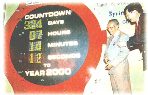
Datuk Bandar merasmikan Swatch Spring/ Summer 1999 Collections di Suria KLCC