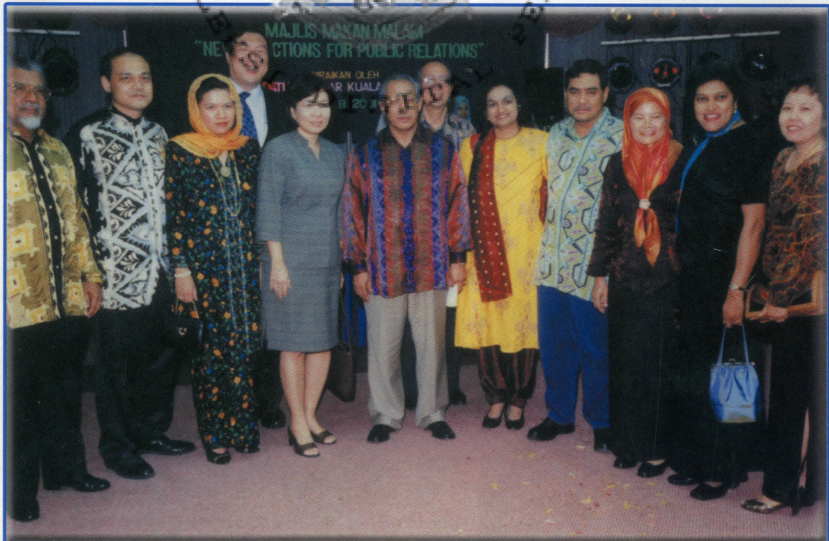
Datuk Bandar Kuala Lumpur (tengah), bergambar dengan Prof. Datuk Hamdan bin Adnan, Presiden IPRM (empat dari kanan), dan sebahagian daripada pengamal-pengamal perhubungan awam.

Tetamu-tetamu yang hadir di Majlis Makan Malam itu telah dipersembahkan dengan tarian dan kumpulan penari kebudayaan diiringi Kombo Kebudayaan DBKL.