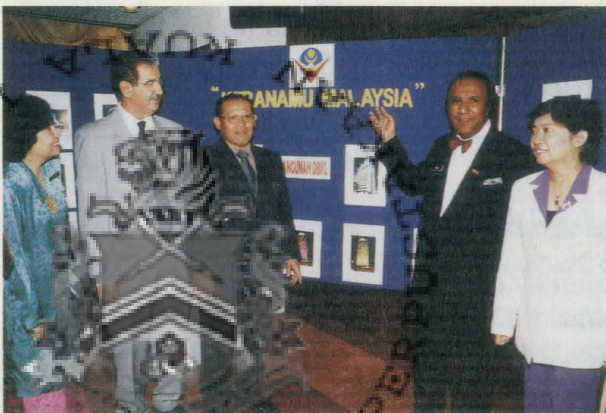
Diterbitkan oleh Unit Akhbar, Bahagian Hal Ehwal Awam, Jabatan Pengurusan Organisasi, DBKL