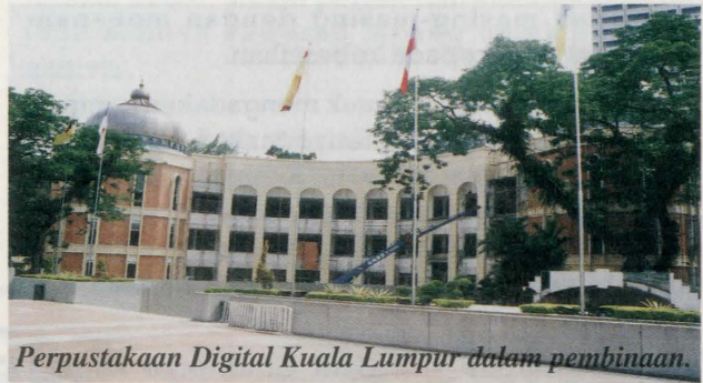
Perpustakaan Digital Kuala Lumpur dalam pembinaan.

Orang ramai yang ingin menjadi ahli boleh menghubungi Perpustakaan Kuala Lumpur di talian 03-2693 2908 atau layari laman web di www.kl.lib.edu.my .