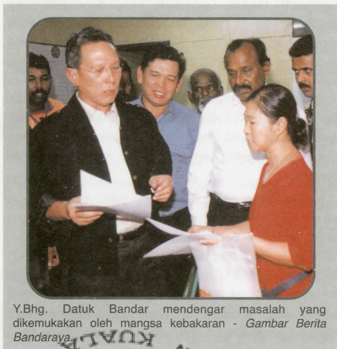
Y.Bhg. Datuk Bandar mendengar masalah yang dikemukakan oleh mangsa kebakaran

Sebanyak 15 keluarga daripada 13 buah rumah yang terlibat di dalam kebakaran telah ditempatkan di situ di mana majoriti mangsa yang terlibat adalah berbangsa India. Rata-rata daripada mereka ini telah lama tinggal di kawasan terbabit manakala ada yang telah menjangkau lebih 30 tahun. Setelah kajian dibuat, DBKL telah bersetuju untuk memindahkan mangsa kebakaran tersebut ke rumah-rumah DBKL secepat mungkin. Datuk Bandar telah