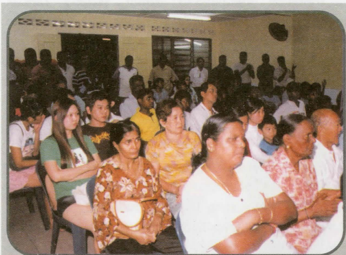
Mangsa-mangsa kebakaran yang berada di penempatan sementara Dewan MIC ketika Y.Bhg. Datuk Bandar menjenguk keadaan mereka

W alaupun Y. Bhg. Datuk Haji Ruslin Haji Hasan, Datuk Bandar Kuala Lumpur sibuk dengan tugas seharian, beliau masih sempat meluangkan masa dan meninjau sendiri keadaan mangsa kebakaran di penempatan sementara di Dewan MIC, Jalan Air Panas, Setapak pada 18 April 2006 baru-baru ini.