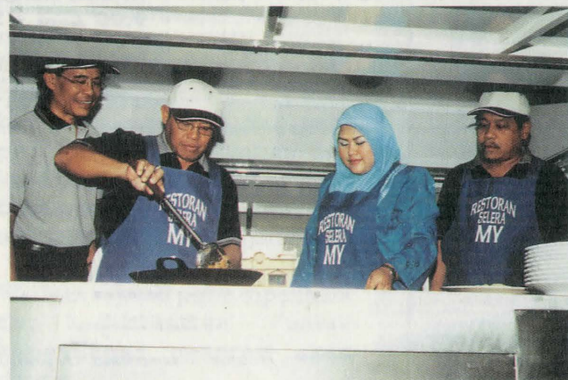
Datuk Bandar Kuala Lumpur sedang menggoreng mee dalam van bergerak sambil diperhatikan Y.B. Datuk Pandikar Amin.

Seterusnya, DBKL akan mengadakan operasi yang sama di lain-lain kawasan seperti Kampung Baru yang terkenal dengan pelbagai jenis perniagaan.