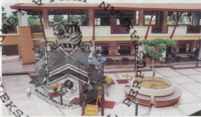
Taman permainan kanak-kanak yang disediakan dalam kawasan pusat penjaja.