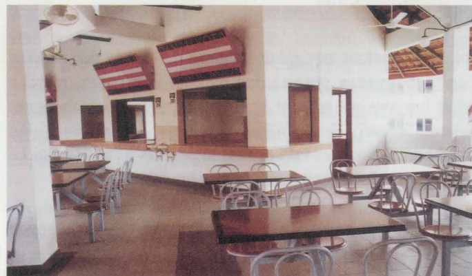
Sebahagian 'food court' yang ada di pusat penjaja ini.