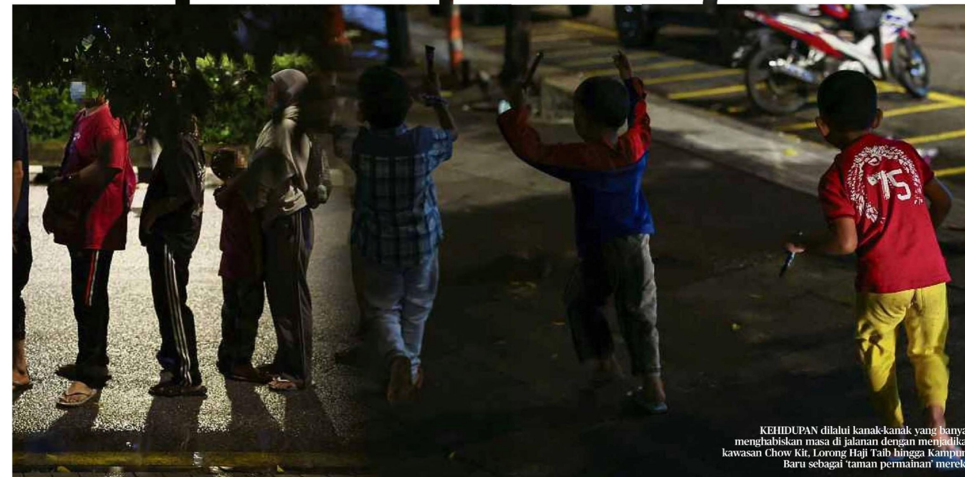
KEHIDUPAN dilalui kanak-kanak yang banyak menghabiskan masa di jalanan dengan menjadikan kawasan Chow Kit, Lorong Haji Taib hingga Kampung Baru sebagai 'taman permainan' mereka.

"Sudah tiba masanya, nasib kanak-kanak lorong ini wajar diberi perhatian serius apatah lagi kerajaan Madani pernah menyuarakan komitmen mereka memerangi masalah keciciran pelajar. Hanya pendidikan yang dapat mengubah mereka" katanya.