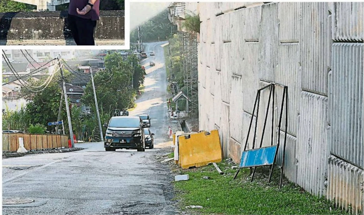
阳光8路于1月16日已重新开放通车,所有路障都被推至路边暂放。