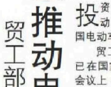
刘镇东：贸工部已建议为购买电动汽车提供一次性补贴，以推动我国电动车工业的发展。

投资、贸易及工业部已建议为购买电动汽车提供一次性补贴，以推动我国电动车工业的发展。