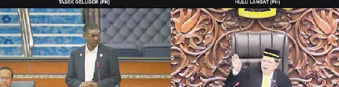
旺赛夫（左上图）在国会爆料，引爆国会骂战！在议长佐哈里（右下图）警告下，旺赛夫撤回言论。右上图为乌鲁冷岳国会议员莫哈末沙尼，左下图为日落洞国会议员雷尔。

议长丹斯里佐哈里阿都开始指旺赛夫并没有指名道姓，因此允许他继续发言，但最终因旺赛夫提到安华的名字，佐哈里即阻止他继续发言。