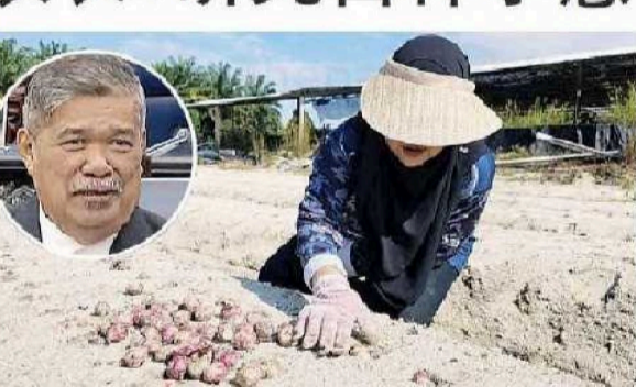
莫哈末沙布：MARDI已着手小葱种植研究工作。

农业及粮食安全部长拿督斯里莫哈末沙布指出，虽然我国自种的小葱价格会比进口价格高，但基于食品安全考量，大马农业研究与发展局（MARDI）已着手小葱种植研究工作。