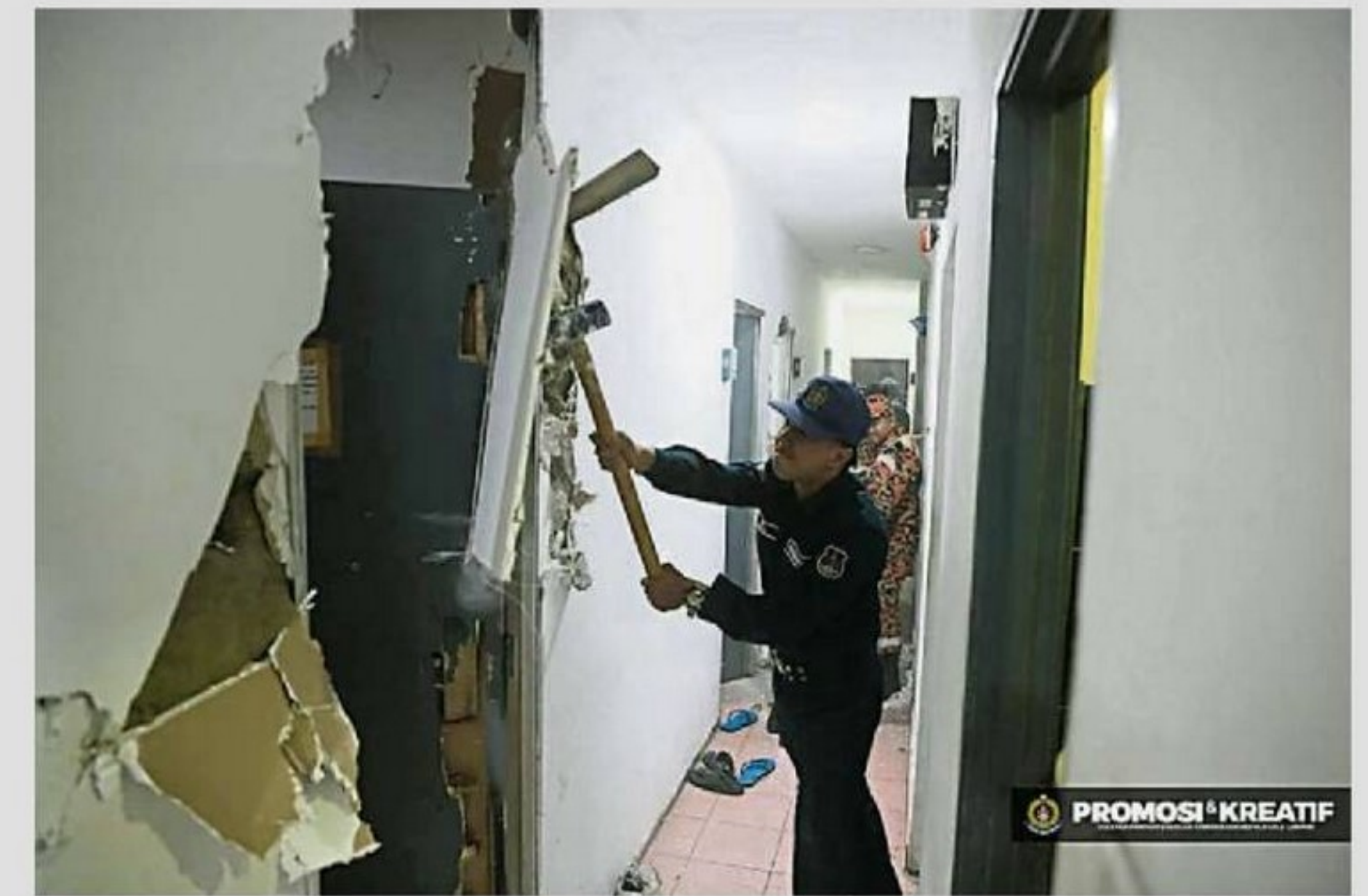
吉隆坡敦陈修信路附近的4个场所内被分隔出108间劏房！