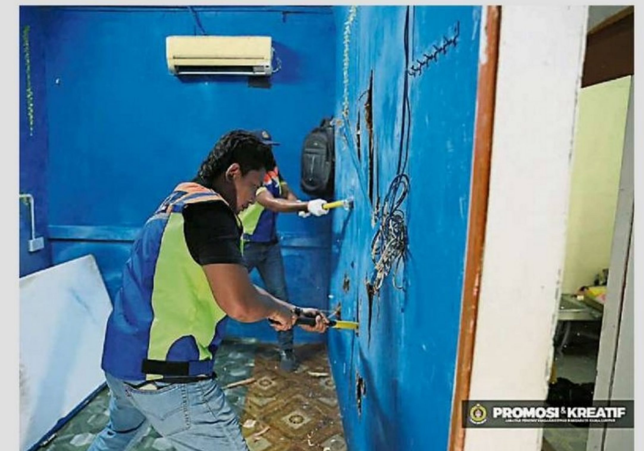
108间劏房均被出租给外籍人士居住和使用。