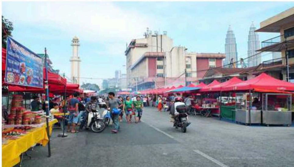
KPDN WPKL akan melakukan pemantauan di lokasi tumpuan. - Gambar Hiasan