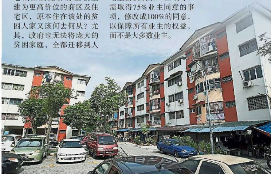
斯里恩达花园组屋重建计划已正式落幕。(档案照)