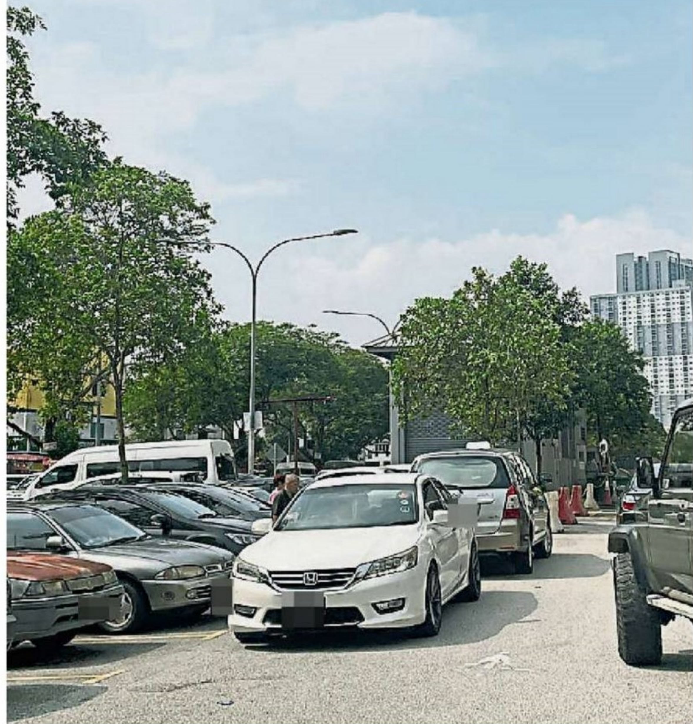
因停車位不足造成多重停車問題，進而導致交通阻礙。

另外，他也指出，該公寓為住區而非商業區，因而反對市政局在該區落實“限時2小時”停車制度，以免影響當地居民的便利。