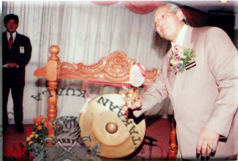
Tan Sri Dato' Kamaruzzaman memukul gang tanda Buku Penerangan Passport to Kuala Lumpur 2000 dilancarkan

Passport to Kuala Lumpur 2000 diletakkan di tempat utama iaitu Lapangan Terbang Antarabangsa Kuala Lumpur, rangkaian bas persiaran, stesen kereta api dan hotel untuk memudahkan pelancong mendapatkan maklumat mengenai pelancongan di Kuala Lumpur dan di seluruh negara. Harga Passport to Kuala Lumpur ialah RM18 senaskhah.