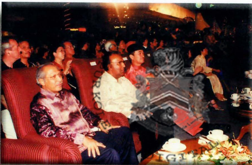
Datuk Bandar Kuala Lumpur, Tan Sri Dato' Kamaruzzaman bin Shariff (kiri) di Majlis Pelancaran Karnival Jualan Mega 2000

Majlis Pelancaran Karnival Jualan Mega 2000 berlangsung di ibu negara telah diadakan secara gilang-gemilang dalam usaha menarik lebih ramai pelancong asing. Pelancaran tersebut dibanjiri oleh kira-kira 20 000 pengunjung yang terdiri daripada warga kota dan pelancong asing, diserikan dengan pelbagai acara menarik. Antaranya ialah pertunjukan fesyen pakaian oleh 100 peragawan dan peragawati, pertunjukan bunga api dan persembahan artis-artis popular tanah air.