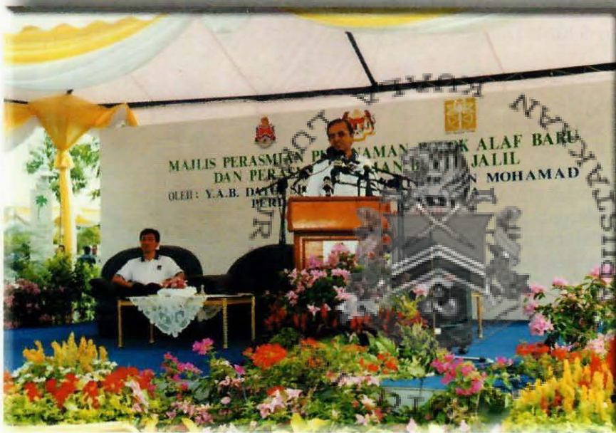
YAB Dato' Seri Dr. Mahathir Mohamad sedang berucap di Majlis Perasmian Taman Bukit Jalil

Pada 15 Oktober 2000 lalu, Perdana Menteri Malaysia, Y.A.B. Dato' Seri Dr. Mahathir bin Mohamad telah merasmikan Taman Bukit Jalil. Perasmian tersebut serentak dengan Pelancaran Penanaman Pokok Alaf Baru oleh Perdana Menteri kita yang telah mengetuai rakyat Malaysia menanam pokok serentak di seluruh negara dalam masa satu minit.