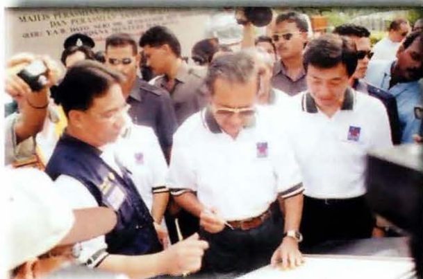
Dato' Seri Dr Mahathir Mohamad sedang menandatangani replika Malaysia Book of Records

Acara bersejarah itu, menyaksikan 100 000 batang pokok ditanam di seluruh negara dalam masa 1 minit, turut dicatatkan dalam Malaysia Book of Records.