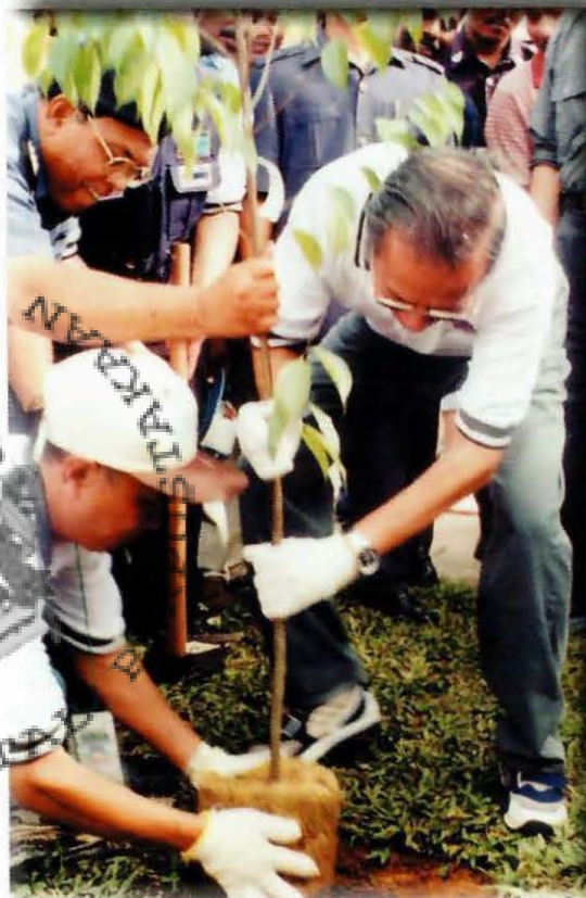
YAB Dato' Seri Dr Mahathir Mohamad sedang menanam pokok

Acara bersejarah itu, menyaksikan 100 000 batang pokok ditanam di seluruh negara dalam masa 1 minit, turut dicatatkan dalam Malaysia Book of Records . Acara itu telah disiarkan secara langsung oleh Radio dan Televisyen Malaysia. Perdana Menteri juga menandatangani sijil replika Malaysia Book of Records bagi mengesahkan penanaman 100 000 pokok.