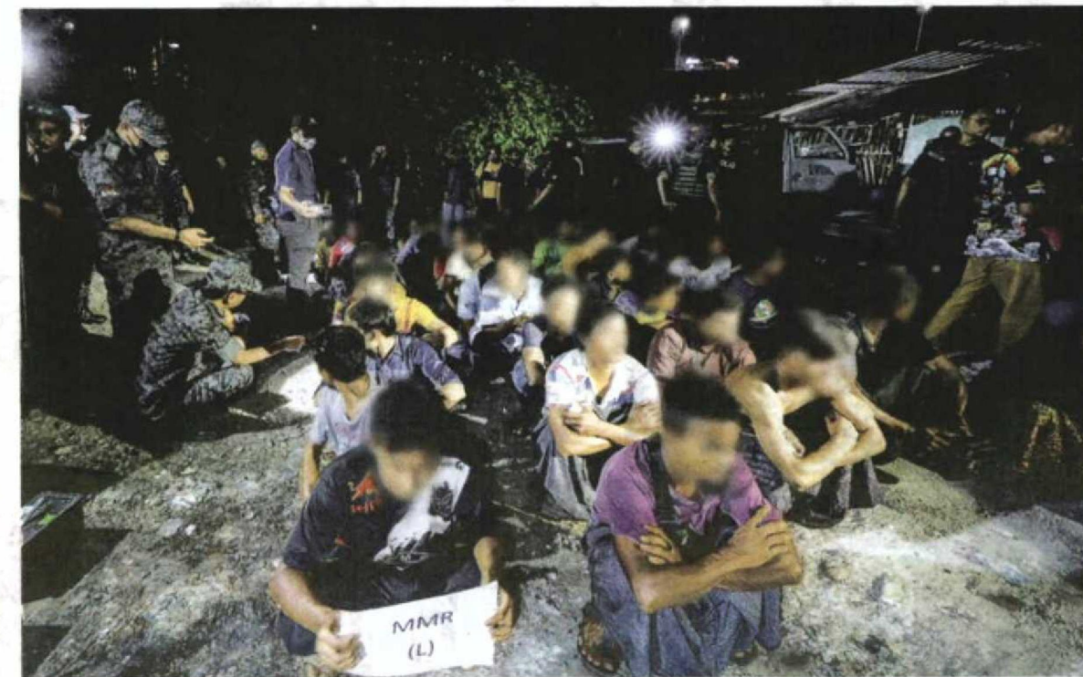
SEBAHAGIAN PATI yang ditahan dalam operasi bersepadu berhampiran Lebuhraya Duke di Sentul, Kuala Lumpur tengah malam semalam.