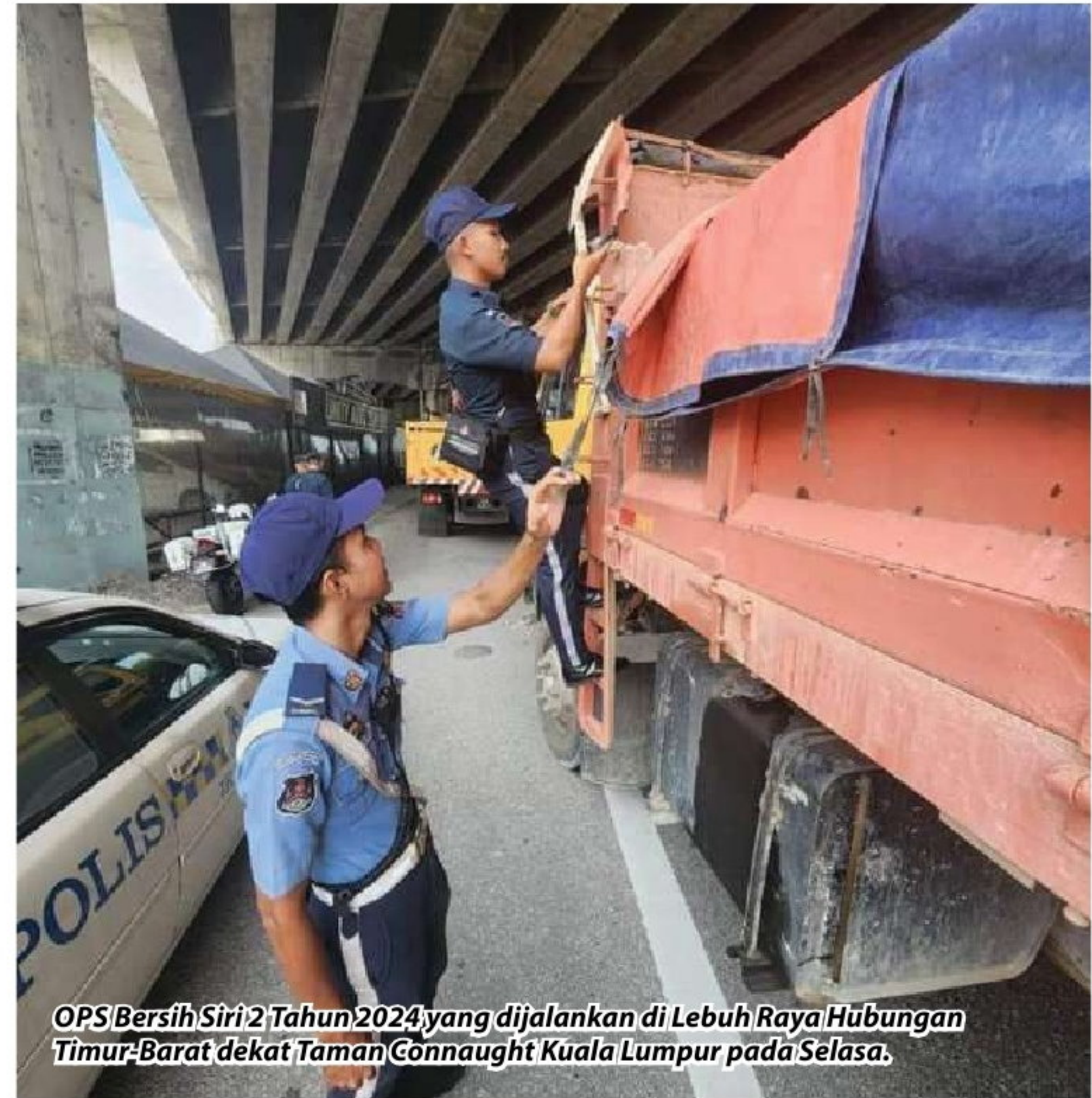
OPS Bersih Siri 2 Tahun 2024 yang dijalankan di Lebuhraya Hubungan Timur-Barat dekat Taman Connaught Kuala Lumpur pada Selasa.