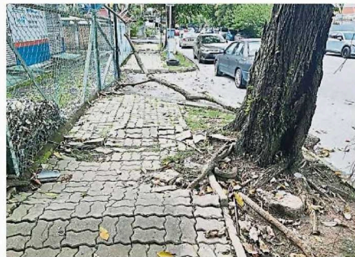
老树根系浮起，撑破地砖。