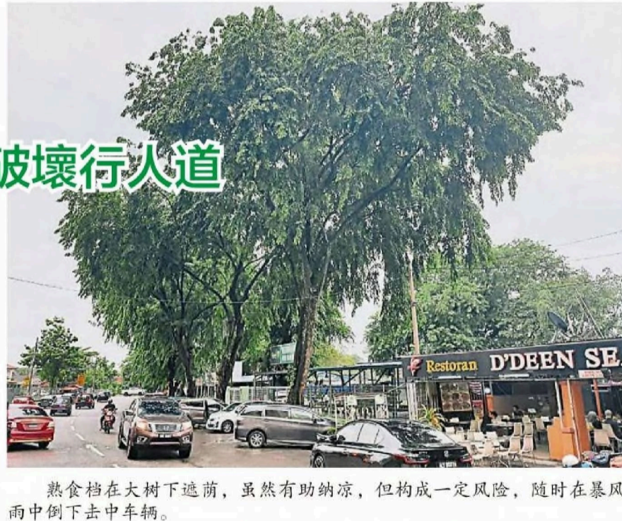
熟食档在大树下遮荫，虽然有助纳凉，但构成一定风险，随时在暴风雨中倒下击中车辆。