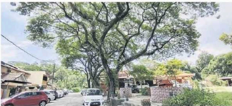
■有著35年树龄的老树令居民们感到惧怕，生怕巨树倒塌。