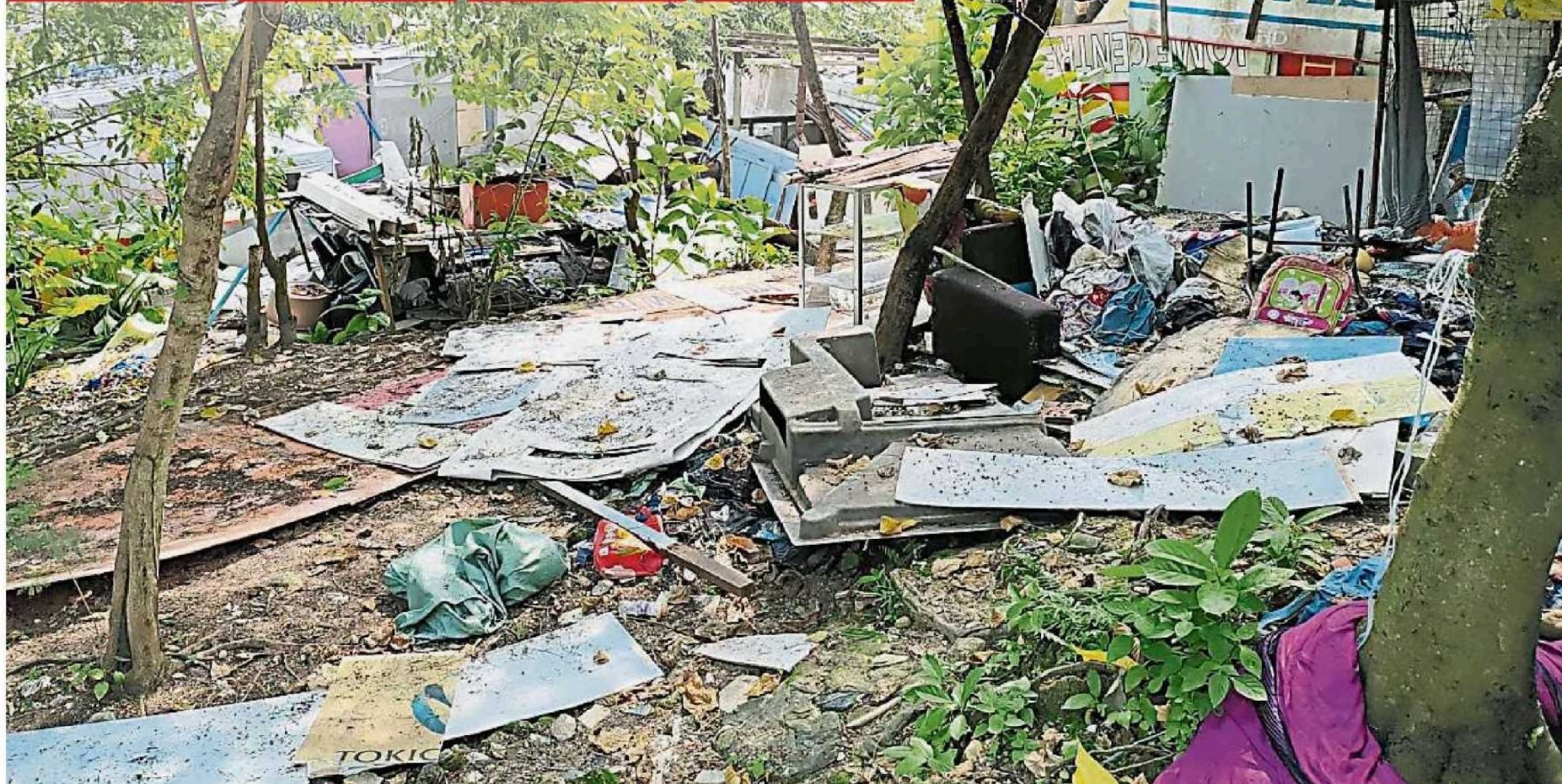
约3英亩大的保留地遭外籍人士霸占，甚至偷偷搭建简陋的住宿。

涉及单位严厉看待上述问题并已展开深入调查，并已在本月4日(星期二)正式发出通知，预计将会在下星期展开行动及清空地段。