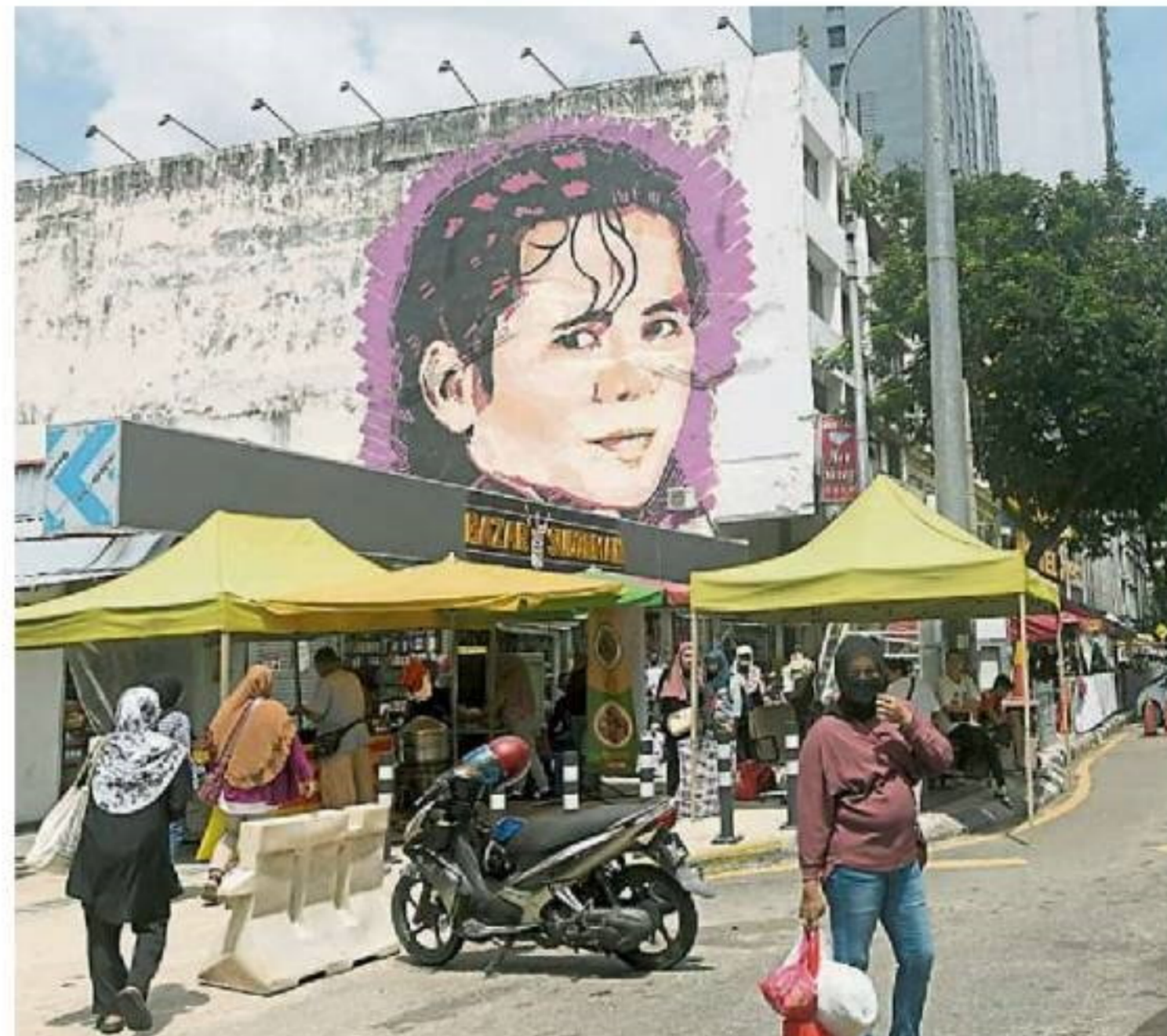
一个转角处都会看见令人眼前一亮的壁画。在吉隆坡市区步行，每一个角落都会看见令人眼前一亮的壁画。