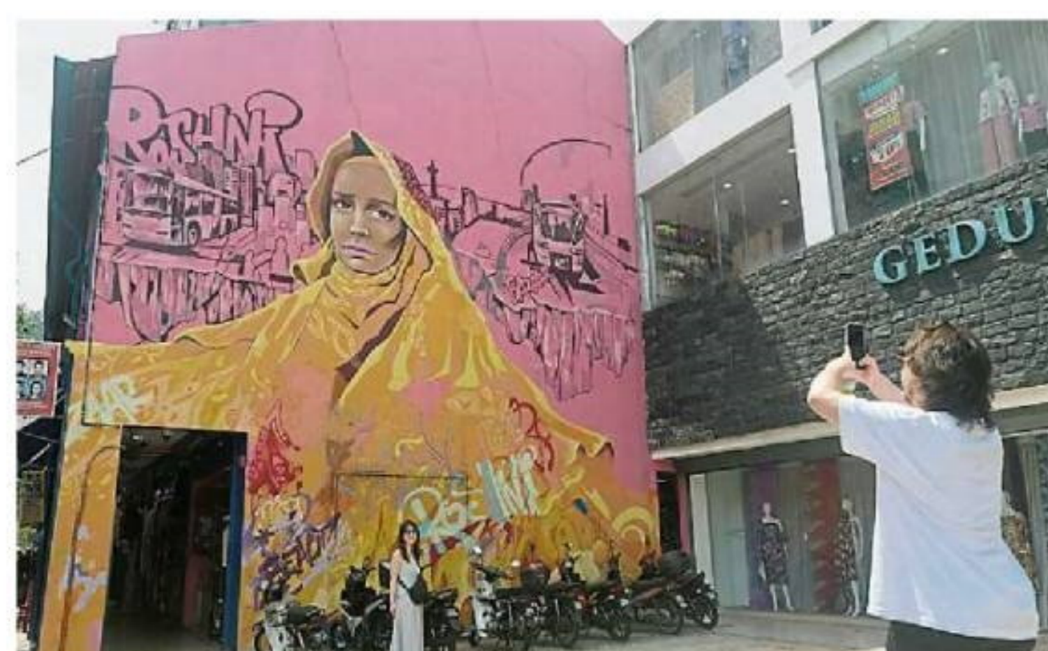
壁画中的印裔妇女身着鲜艳的黄色服装，粉红色的背景相当抢眼。