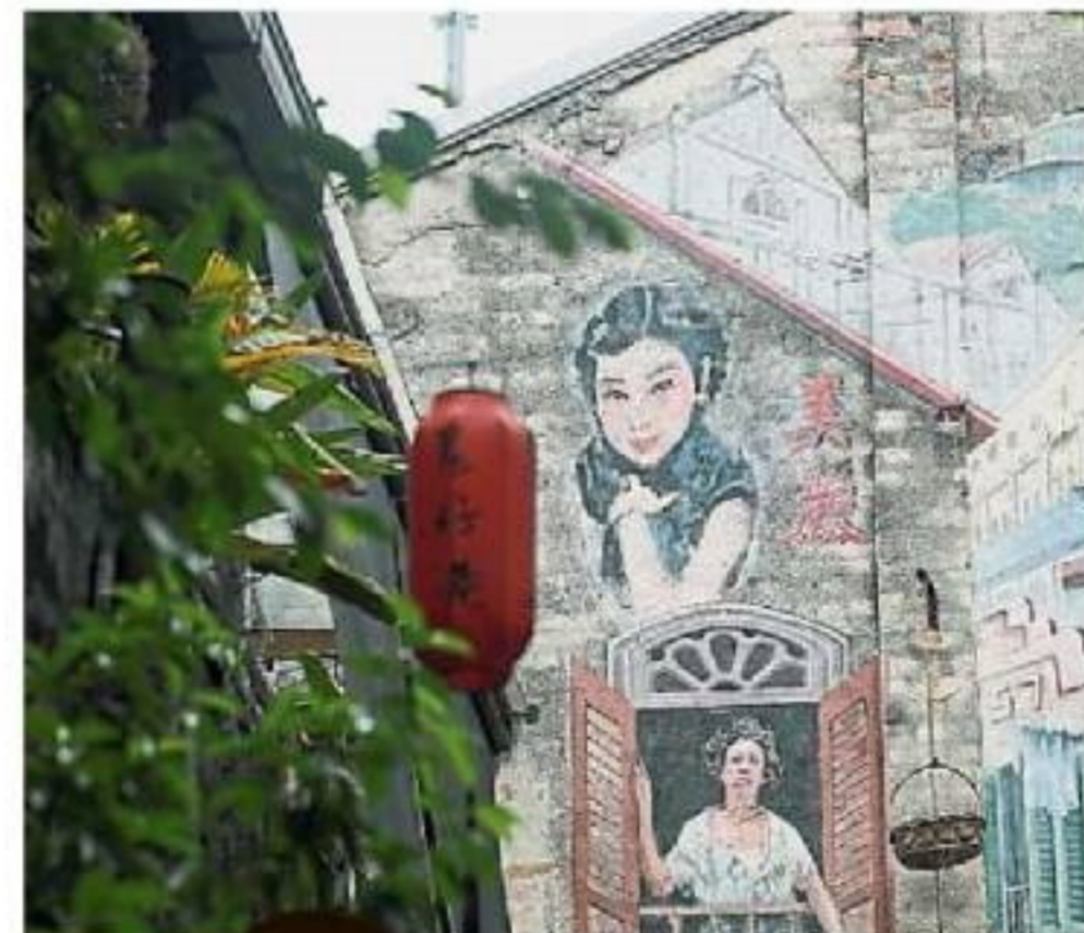
左图：鬼仔巷墙面上，有许多风情万种的壁画，赏心悦目。右图：鬼仔巷壁画魅力无法挡，就连友族同胞也前来拍照打卡。

地址：Jalan Dang Wangi & Jalan Kamunting intersection