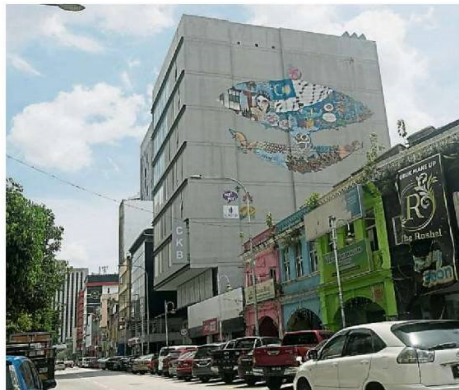
亮的壁画。在吉隆坡市区除了有一栋栋高楼建筑物，还有一幅幅漂亮的壁画。