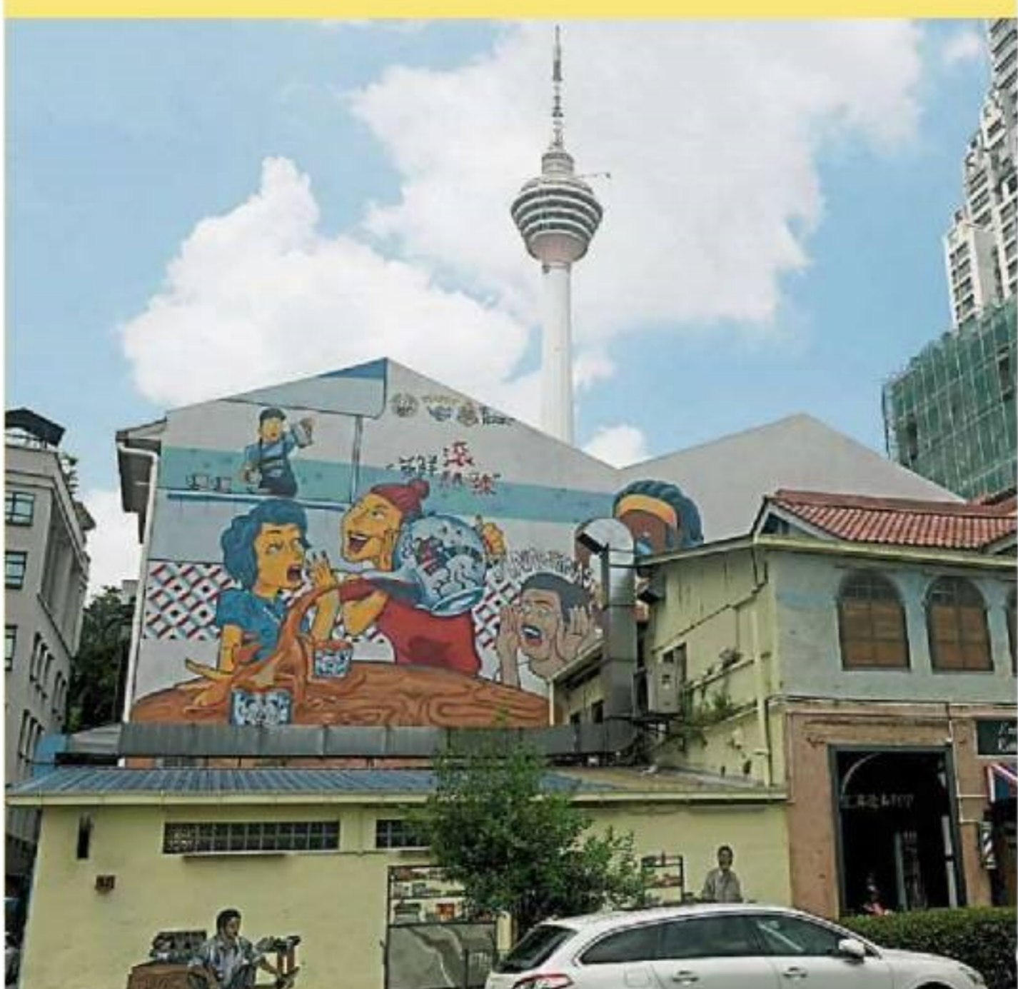
步行在壁画街上，还能看见远在天边的吉隆坡塔。