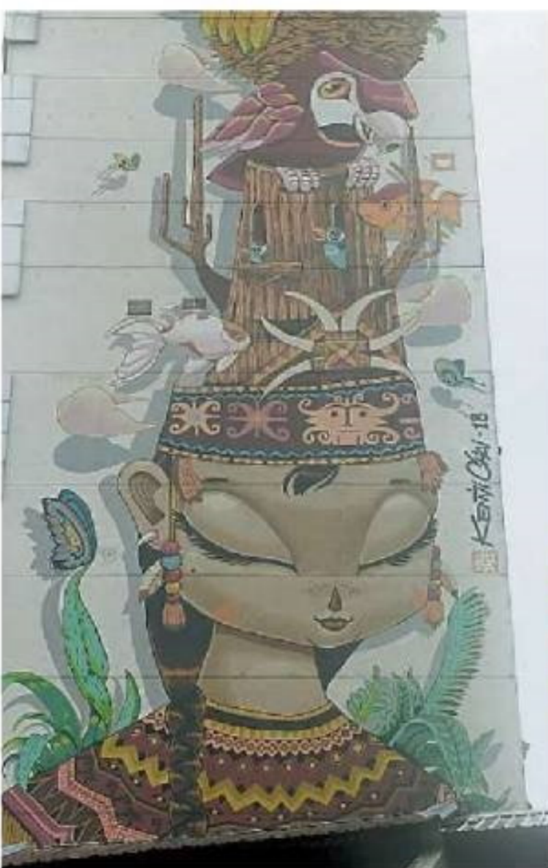
金马路上的墙壁上，画着一名身着传统服装的达雅族妇女。