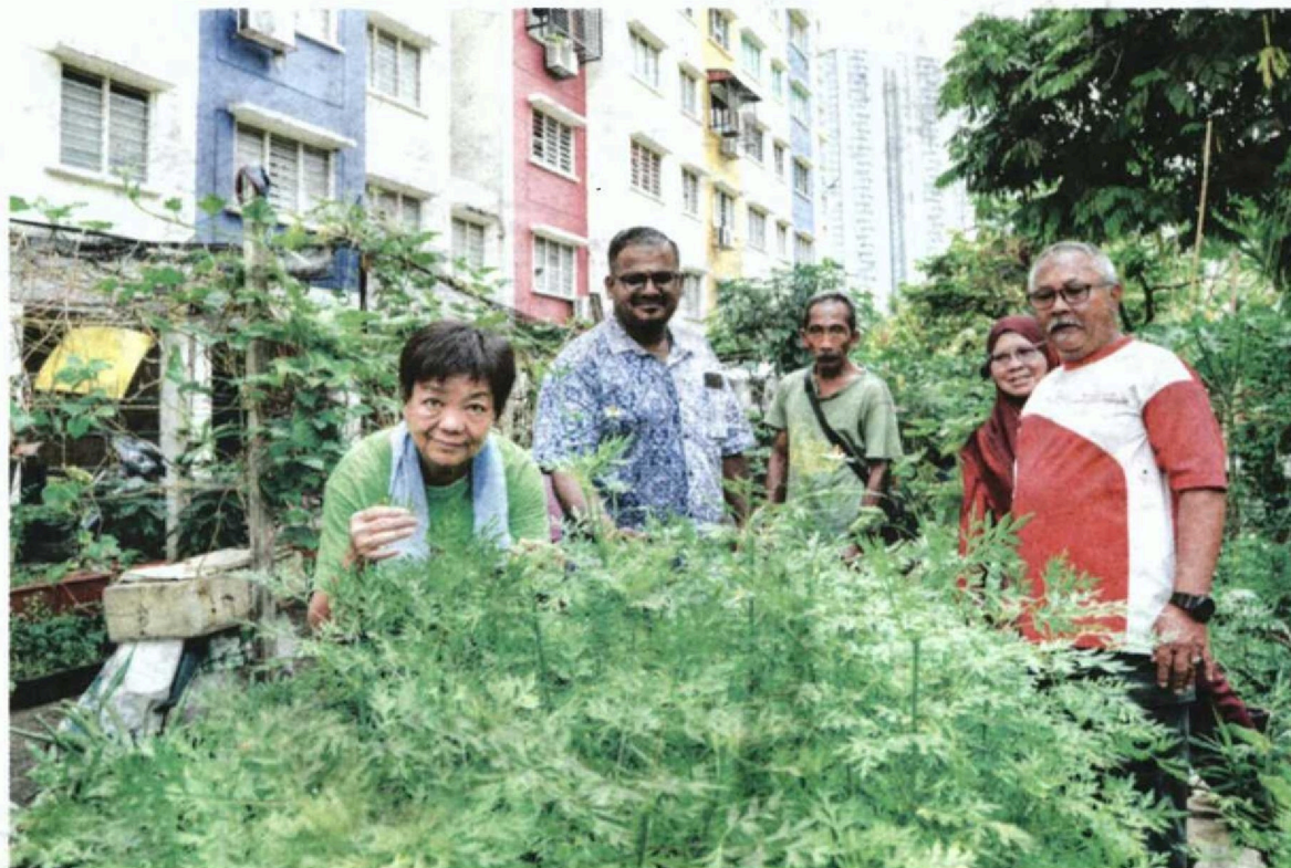
KEBUN Komuniti inisiatif kerajaan untuk menjadikan aktiviti pertanian sebagai gerakan negara ke arah keterjaminan makanan.

Memiliki sekitar 16,000 penduduk di PPR itu menjadikan perpaduan merupakan antara elemen utama diterapkan dalam kalangan penduduk.