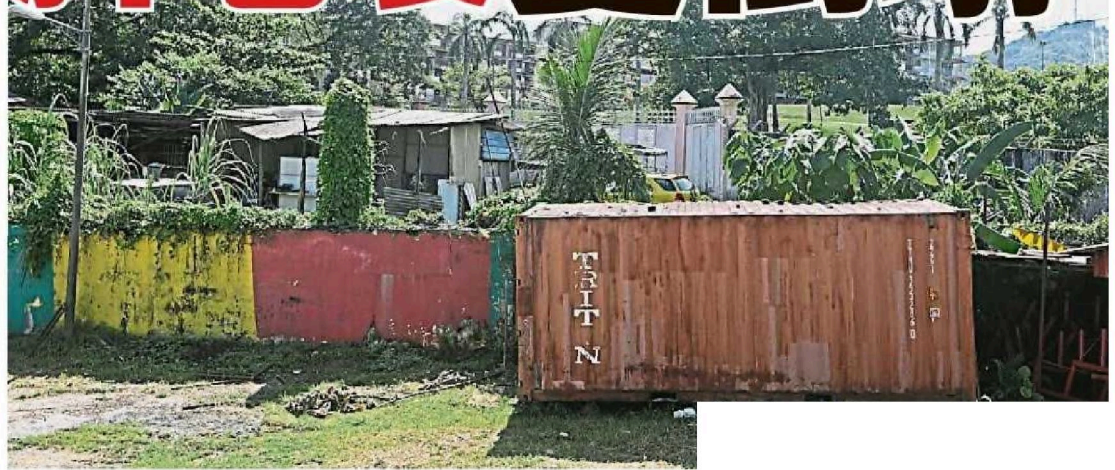
仙四師爺廟的圍牆與後方空地的車廠相近。

廟內的地面滲出水迹，尤其在下雨後更為嚴重，讓他們懷疑因後方空地不設排水系統所導致。