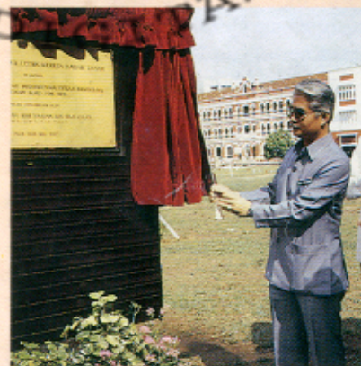
Menteri Wilayah Persekutuan merasmikan Projek Usahasama Letak Kereta Bawah Tanah.

“Dalam melaksanakan projek ini, kerajaan hanya memberikan hak