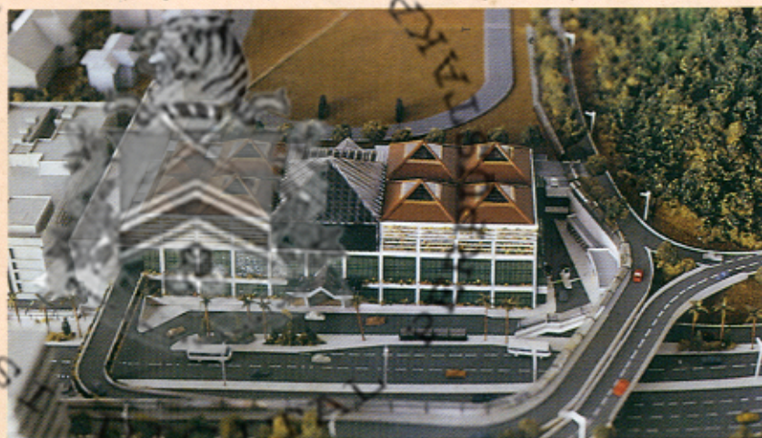
Model Kompleks Letak Kereta Bawah Tanah.

Akhirnya beliau berkata, pelaksanaan projek letak kereta bawah tanah ini tidak akan menjejaskan keindahan kawasan tersebut kerana ianya dibina di bawah paras padang. Malah pihak pemaju akan menanam pokok-pokok di sekitar kawasan berkenaan dan membina sebuah kompleks sukan yang terdiri daripada tiga gelanggang skuasy dan