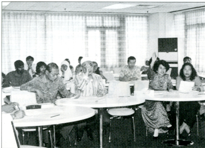
Sebahagian daripada para peserta konvensyen.