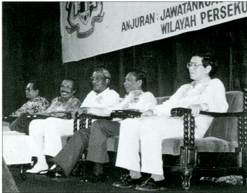
Dato' Elyas: Semangat persaudaraan ... dan semangat kewarganegaraan.

Yang lebih penting, kata Datuk Bandar, ialah matlamat untuk mewujudkan satu bangsa Malaysia yang dapat mencerminkan identiti tersendiri. Setiap lapisan masyarakat, tidak kira tua, muda atau keturunan, haruslah mempunyai tanggungjawab dan kewajipan terhadap pembangunan negara.