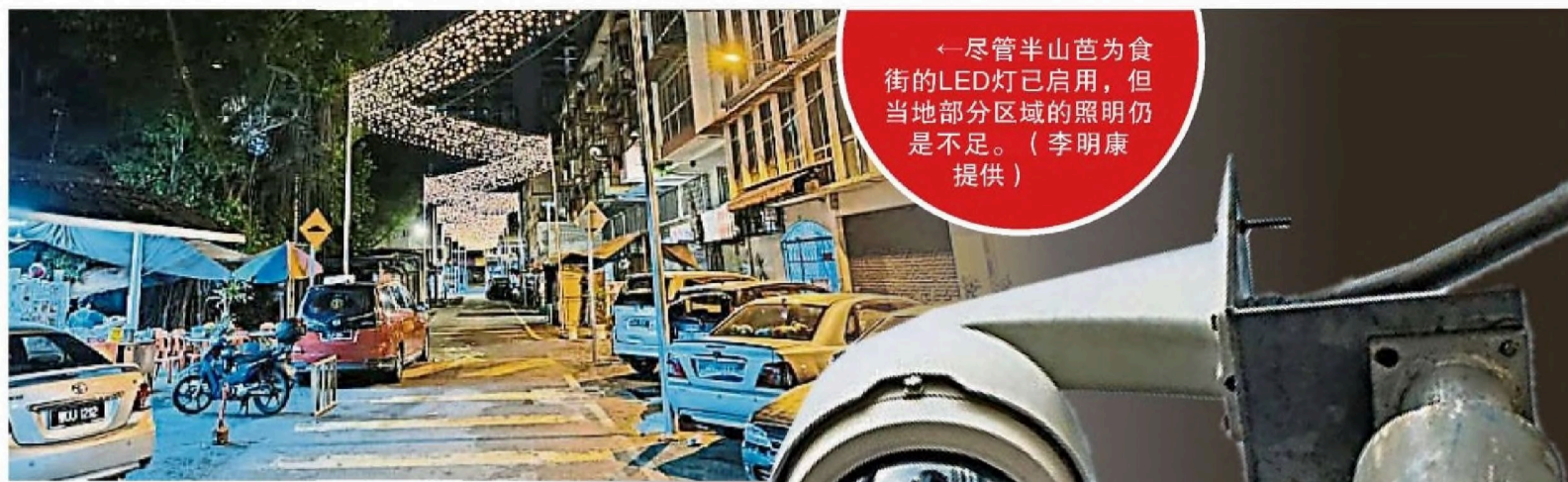
← 尽管半山芭为食街的LED灯已启用，但当地部分区域的照明仍是不足。