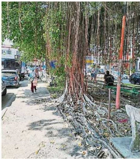
公园的大树根部已经长出走道和草地表面，之后将被挖除。