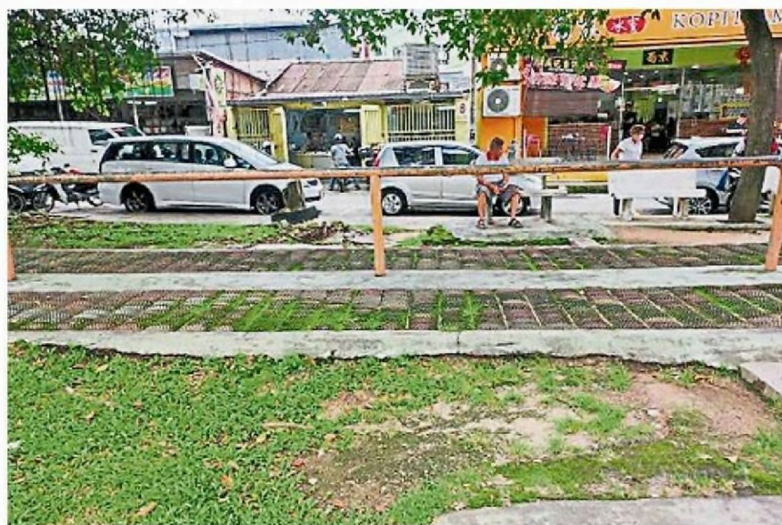
↑增江新花园4/32路休闲公园的草地和走道将会重铺。