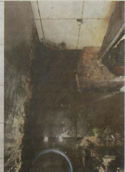
Antara premis yang didapati kotor dan dikenakan kompaun.