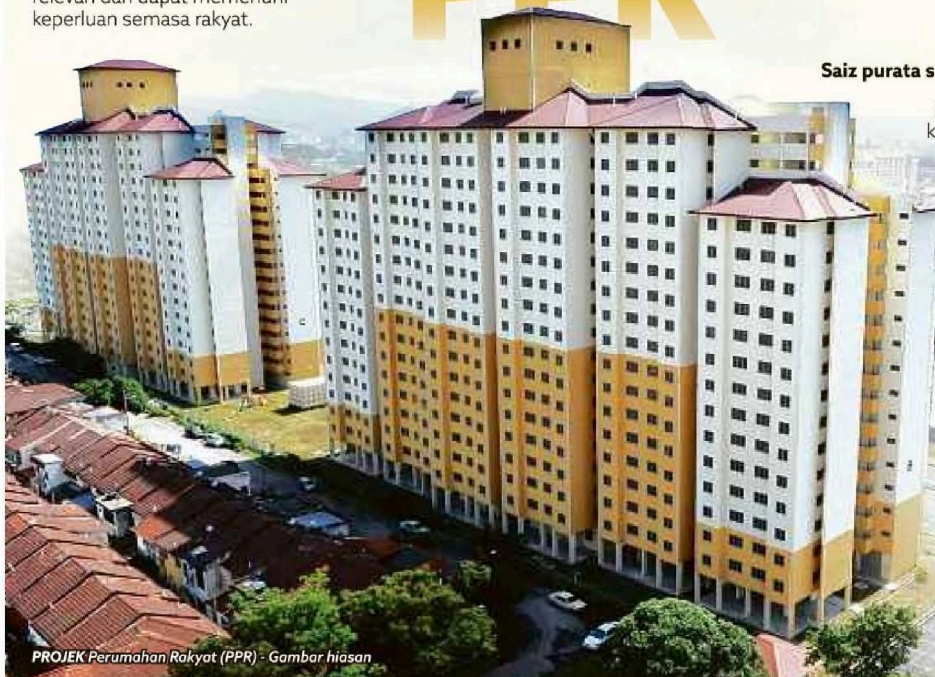
PROJEK Perumahan Rakyat (PPR) - Gambar hiasan