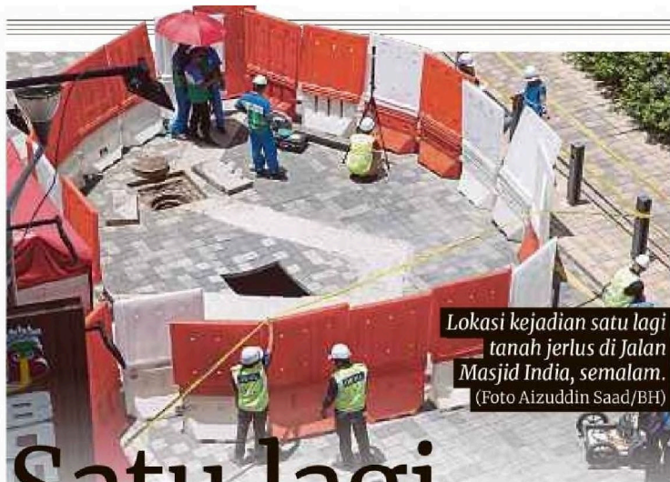
Lokasi kejadian satu lagi tanah jerlus di Jalan Masjid India, semalam.