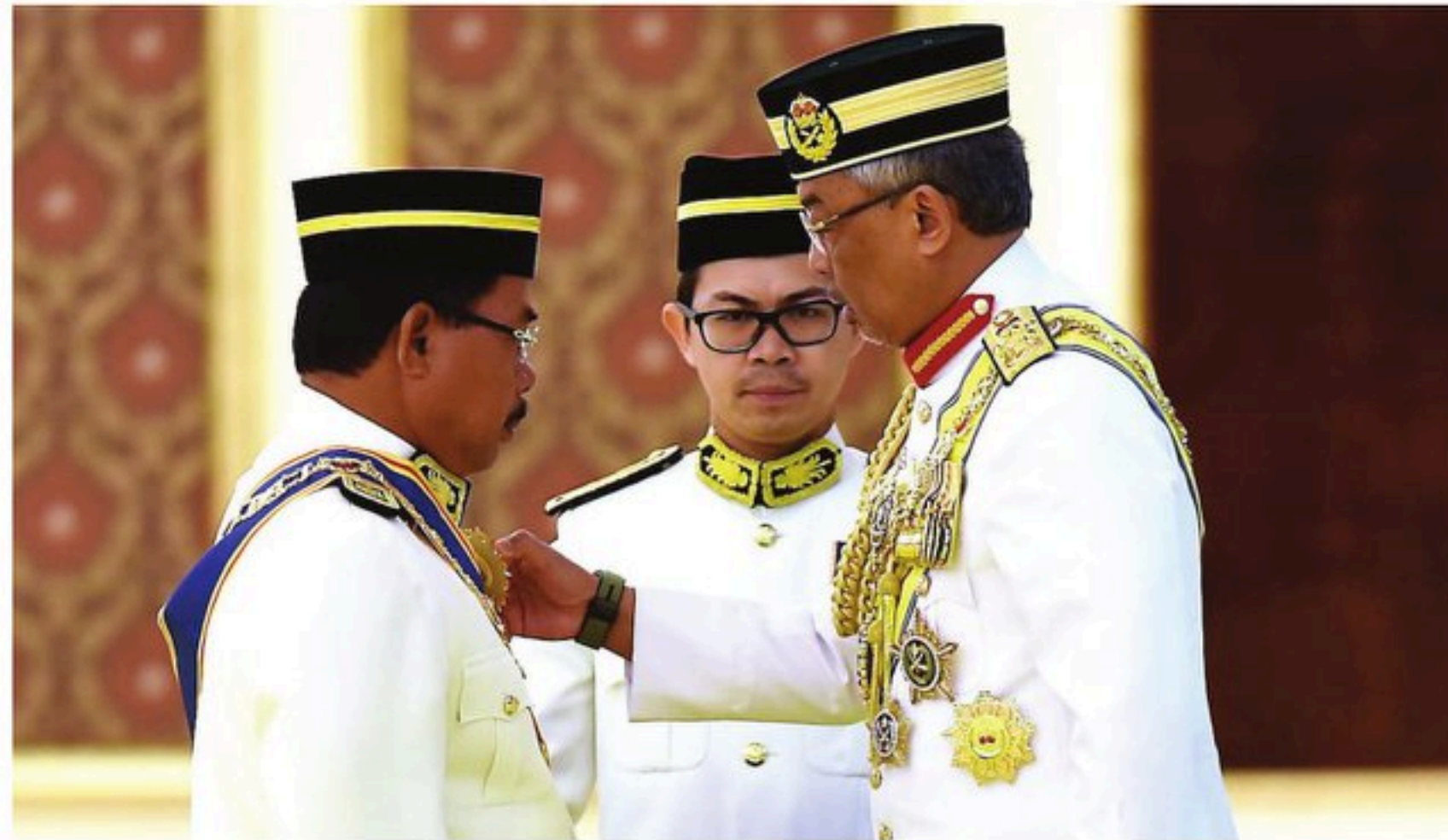
AL-SULTAN ABDULLAH (kanan) berkenan mengurniakan Darjah Seri Mahkota Wilayah (SMW) kepada Ketua Pengarah Bahagian Hal Ehwal Undang-Undang, Jabatan Perdana Menteri, Datuk Jalil Marzuki di Istana Negara, Kuala Lumpur baru-baru ini.

"Maka, saya ingin mengajak setiap lapisan masyarakat tanpa mengira darjat mahupun bangsa dan agama untuk ber-