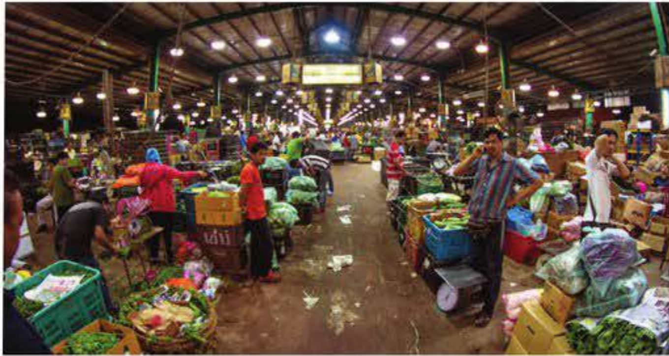
KEGIATAN memeras ugut peniaga di pasar borong di sekitar ibu negara sedang dipantau pihak polis. - Gambar hiasan.

Tambah beliau, siasatan dijalankan mengikut Seksyen 384 Kanun Keseksaan iaitu melakukan pemerasan dan orang ramai yang mempunyai sebarang maklumat diminta menghubungi Hotline Polis Kuala Lumpur di talian 03-2115 9999, Bilik Gerakan Khas 24 Jam Jabatan Siasatan Jenayah Polis Kuala Lumpur di talian 03-2146 0670 atau hadir ke mana-mana Balai Polis yang berdekatan.