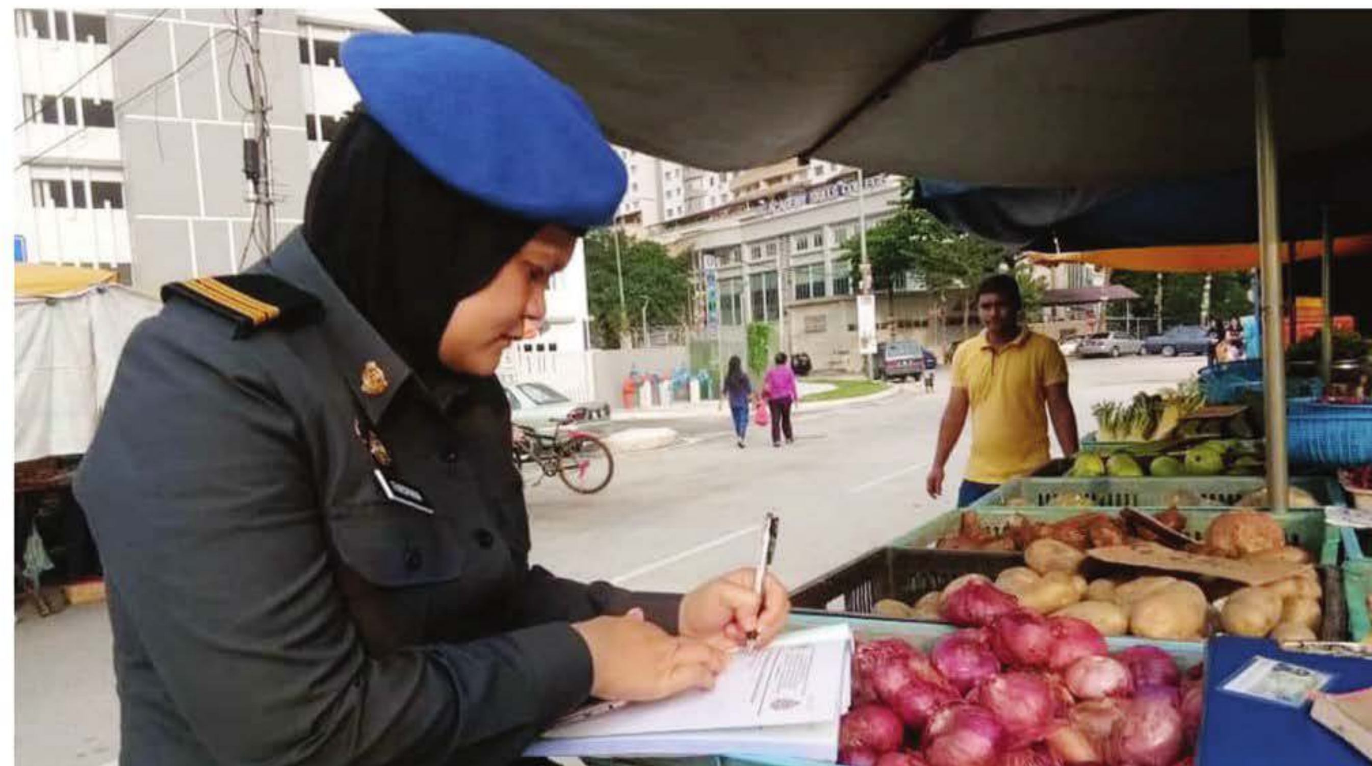
SEORANG pegawai penguatkuasa KPDNHEP membuat pemeriksaan ke atas peniaga pasar malam di ibu kota baru-baru ini.

SERAMAI kira-kira 2,300 pegawai penguatkuasaan Kementerian Perdagangan Dalam Negeri dan Hal Ehwal Pengguna (KPDNHEP) akan dibekalkan dengan gajet dalam operasi ke atas premis-premis perniagaan bagi merekodkan semua data bagi tujuan siasatan dan tindakan.