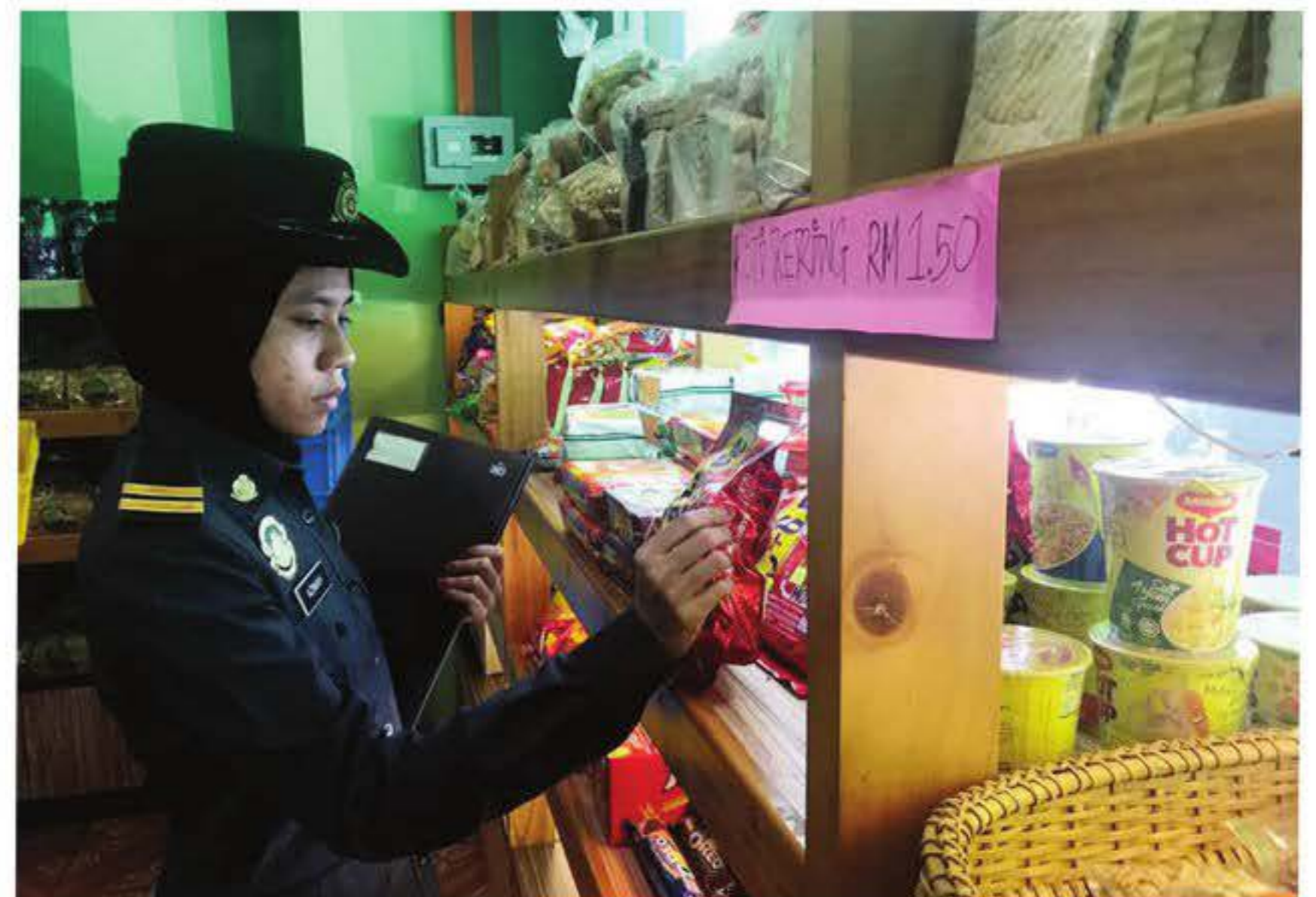
PEGAWAI penguatkuasa KPDNHEP pada masa ini terpaksa mencatatkan maklumat secara manual ketika membuat pemeriksaan. - Gambar hiasan

pemeriksaan menggunakan kertas, jadi saya tidak mahu ia berterusan begitu. Saya mahu mereka menggunakan aplikasi sejajar dengan perkembangan