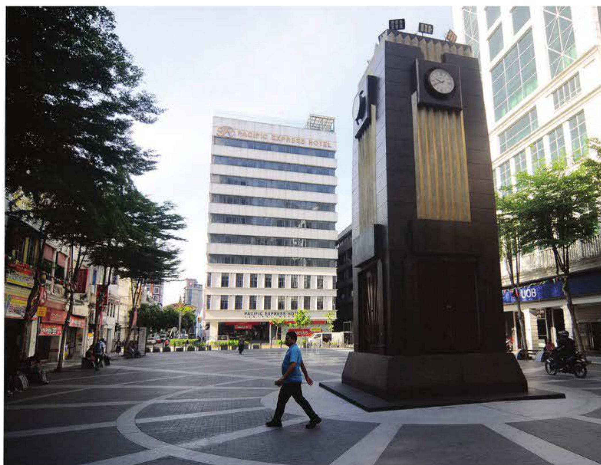
KAWASAN pejalan kaki di Leboh Ampang antara laluan yang dicadang sebagai lorong buku.