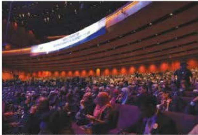
TETAMU dan peserta memberikan tumpuan kepada ucapan pembukaan Sidang Kemuncak Kuala Lumpur baru-baru ini.

Dr. Mahathir yang juga Pengerusi sidang kemuncak itu menegaskan, pergantungan kepada negara-negara kuasa besar untuk dana misalnya turut menjadikan negara-negara yang bebas