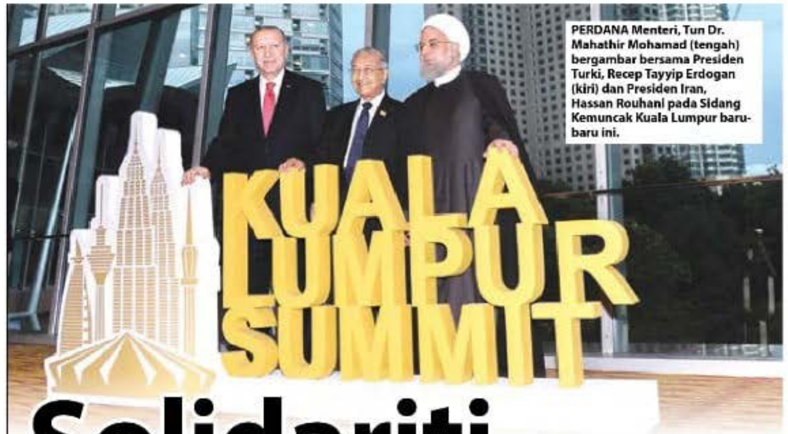
PERDANA Menteri, Tun Dr. Mahathir Mohamad (tengah) bergambar bersama Presiden Turki, Recep Tayyip Erdogan (kiri) dan Presiden Iran, Hassan Rouhani pada Sidang Kemuncak Kuala Lumpur baru-baru ini.