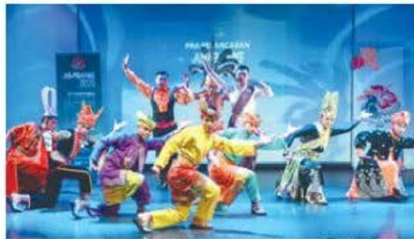
PERSEMBAHAN tarian tradisional berwajahkan budaya Malaysia bakal dipersembahkan pada Ambang 2020@Kuala Lumpur di Dataran Merdeka pada 31 Disember ini.

berkenaan juga bertujuan menyemarakkan kempen nilai-nilai murni sebagai wadah pelancongan, seni dan budaya.