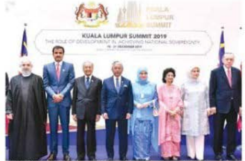
SULTAN ABDULLAH (lima dari kanan) berkenan berangkat merasmikan pembukaan Sidang Kemuncak Kuala Lumpur di KLCC baru-baru ini.

dang kemuncak itu menyatakan komitmen untuk melaksanakan penyelesaian pragmatik untuk memulihkan ketamadunan Islam, memperbaiki keadaan semasa ummah dan memperluas jangkauan pembangunan ekonomi serta sains, teknologi dan inovasi untuk manfaat generasi akan datang.