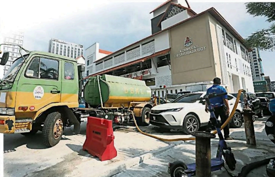
吉隆坡市政局每日派遣10至12辆水槽车, 为拉惹柏巴刹商販提供临时水供。(档案照)