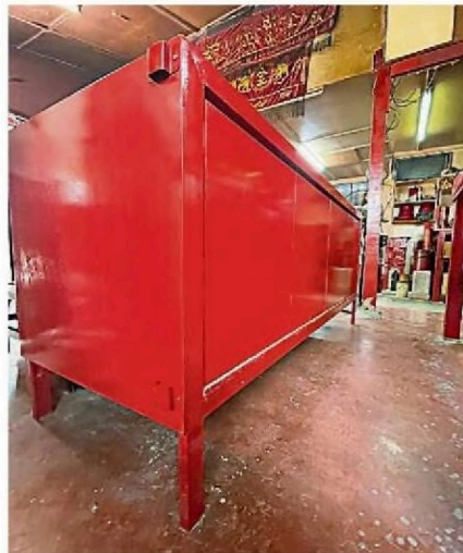
庙方特别将神台提高,以免在水灾时受到破坏。