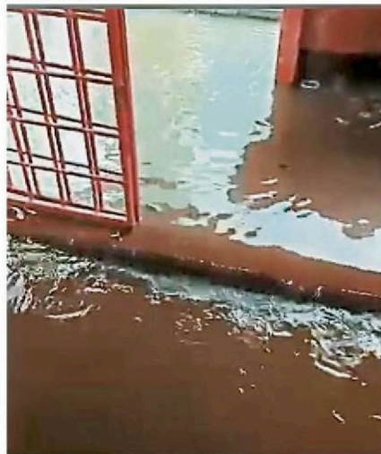
慈显堂水灾问题在近3年越发严重,每逢下雨一定会发生水灾,淹进庙内的水高甚至达3呎。