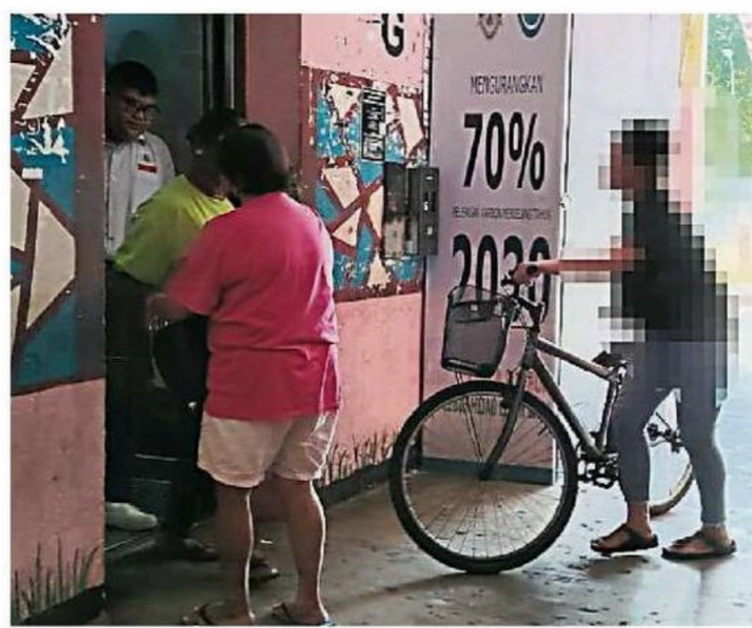
◀ 公众推脚车进电梯，违反使用规则。 ▼ 电梯是组屋住户基本需求，安全性使用备受关注。