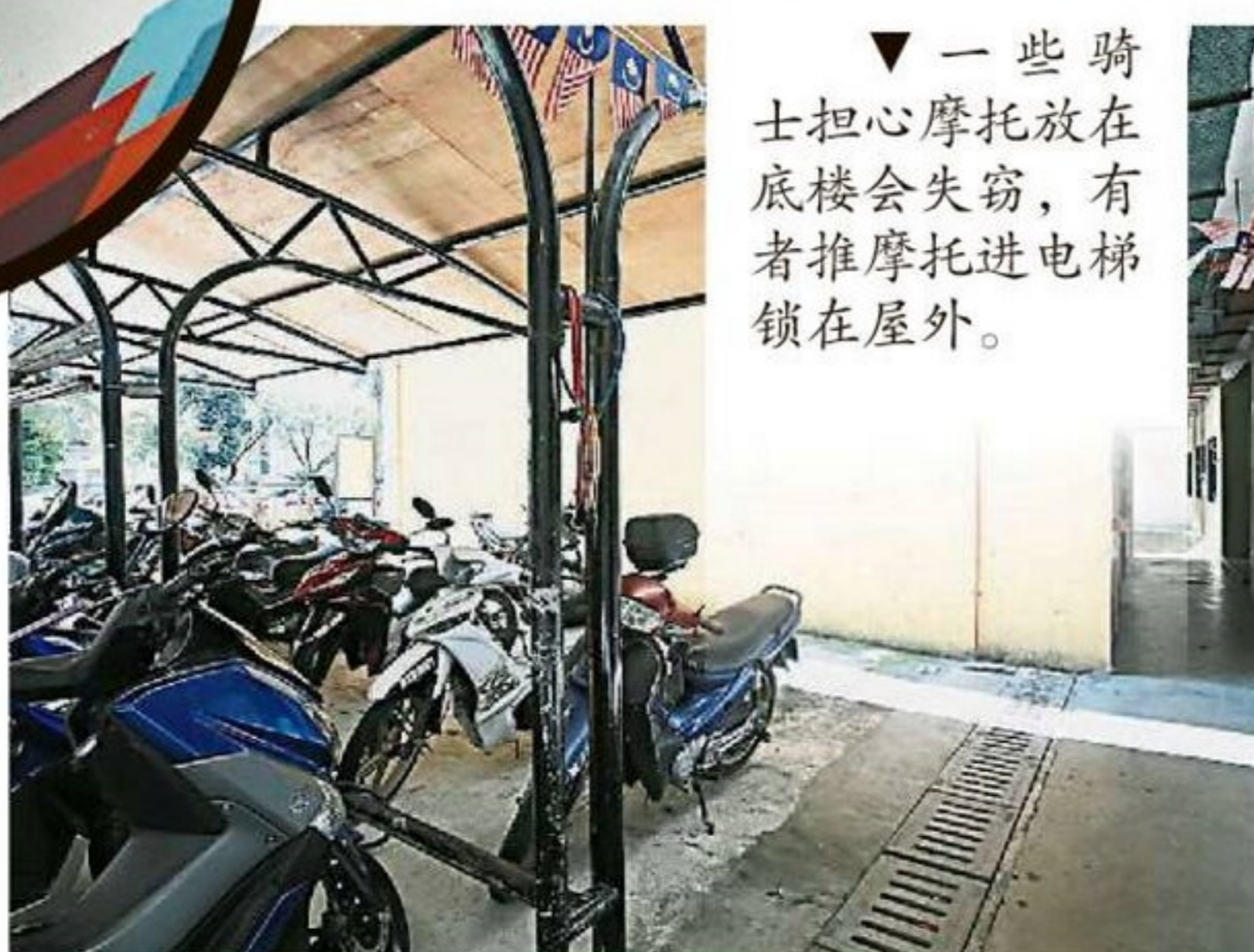
▼ 一些骑士担心摩托放在底楼会失窃，有者推摩托进电梯锁在屋外。

（吉隆坡23日讯）在电梯小便、踢门、大力挡门、弹跳、骑摩托车进电梯、承载重型垃圾或砂石等，粗暴使用与人为破坏行为，是导致人民组屋电梯极速“减寿”的种种原因。