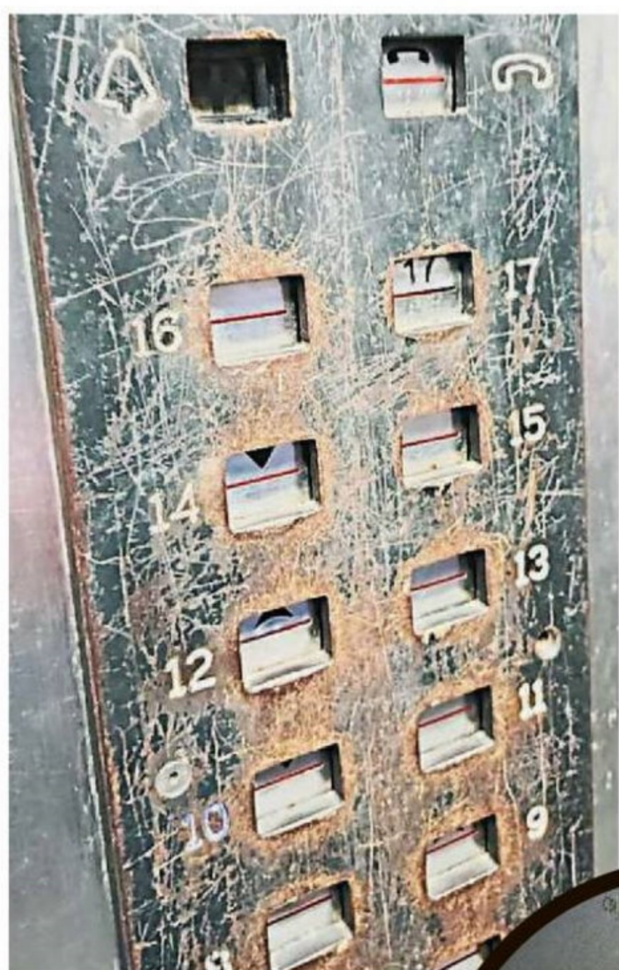
▲ 面板控制器生锈。