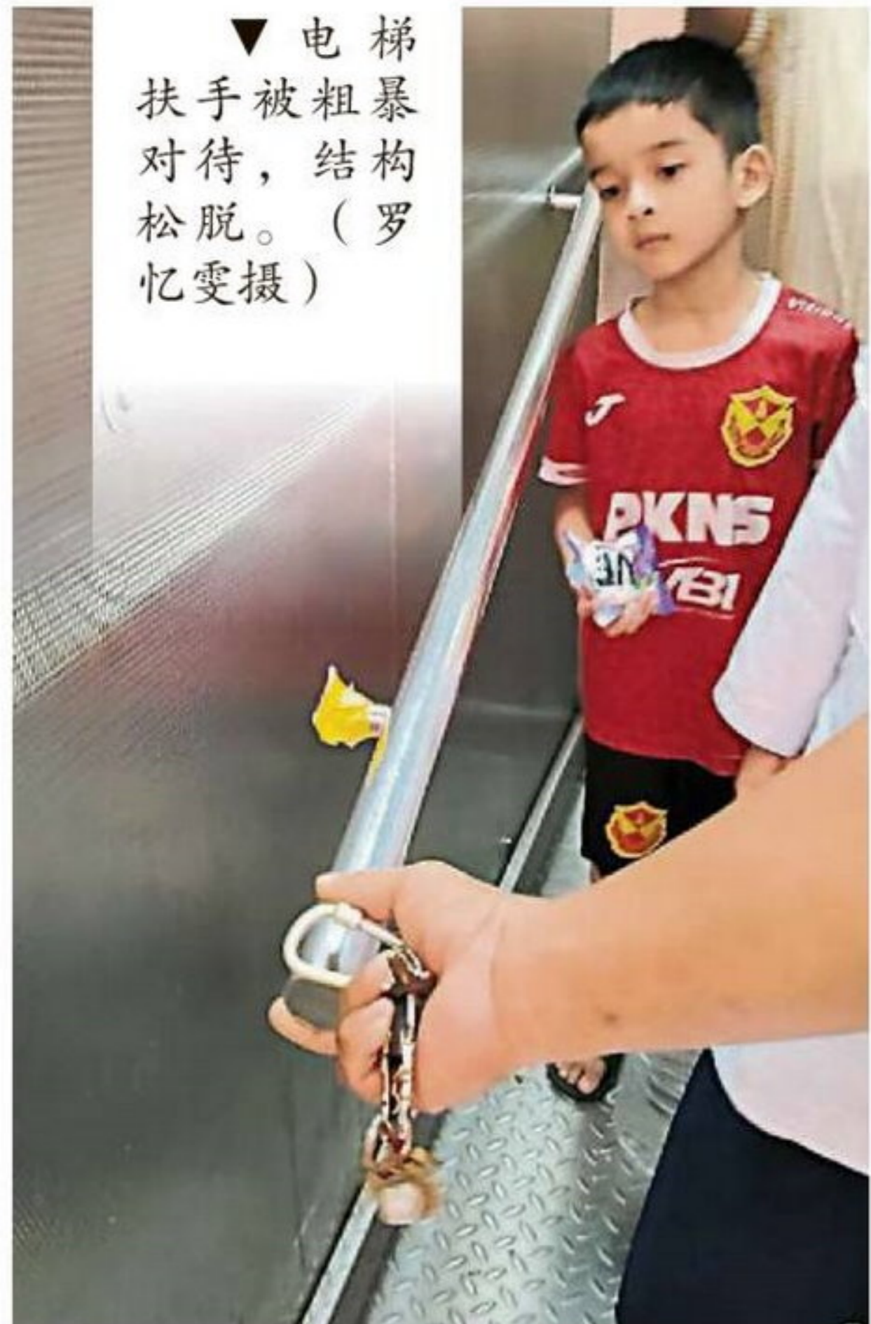
▼ 电梯扶手被粗暴对待，结构松脱。