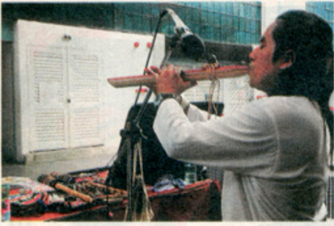
MENARIK: Persembahan muzik tradisional memikat pelancong.