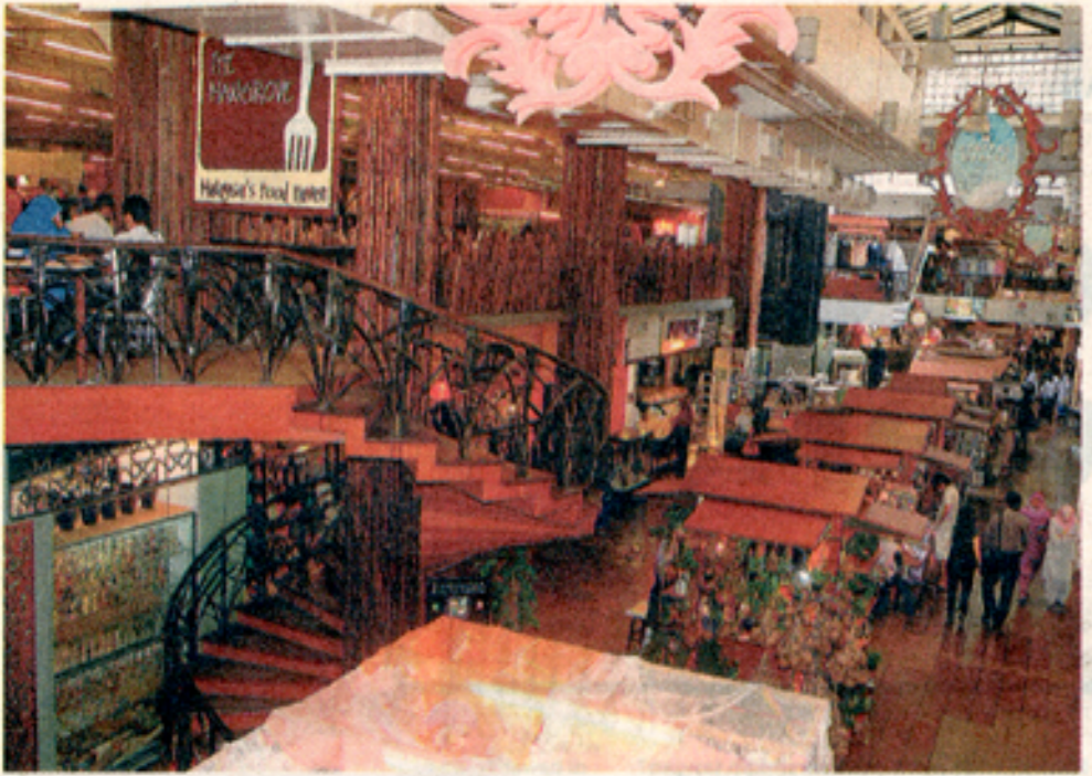
KEMAS: Pasar seni nampak lebih segar dengan pelbagai hiasan dan gerai menjual pelbagai produk.