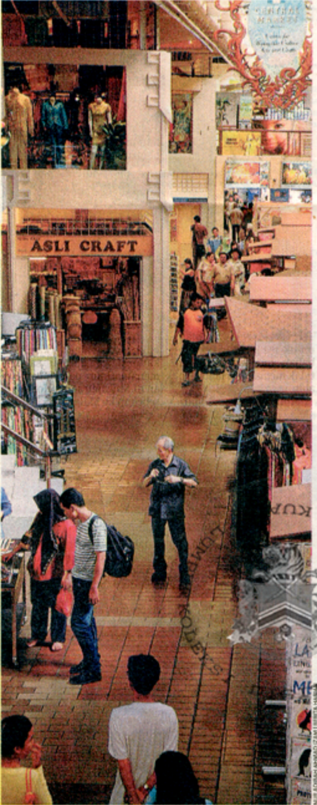
DESTINASI POPULAR: Pemandangan di Pasar Seni.