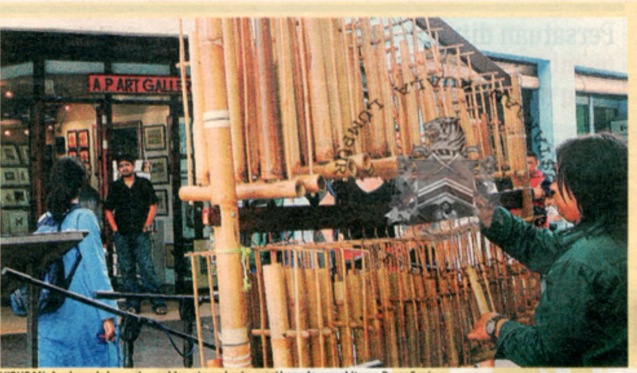
HIBURAN: Anak muda bermain angklung 'memberi warna' kepada persekitaran Pasar Seni.