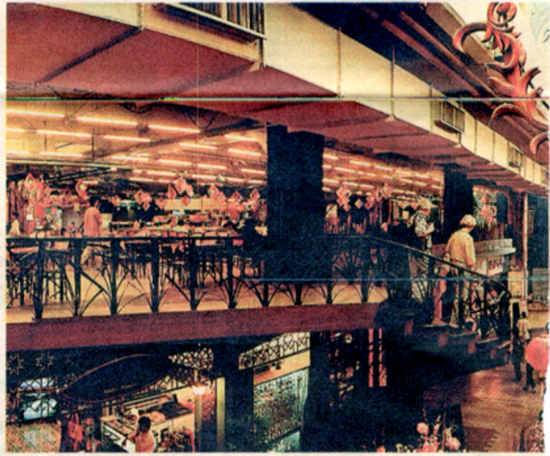
TAK SUNYI: Pasar Seni meriah dengan pelbagai kegiatan.

Memang sejak sekitar 1980-an bangunan lama yang sarat dengan ciri khazanah dan warisan budaya itu nampak meriah dengan pelbagai aktiviti daripada menjual